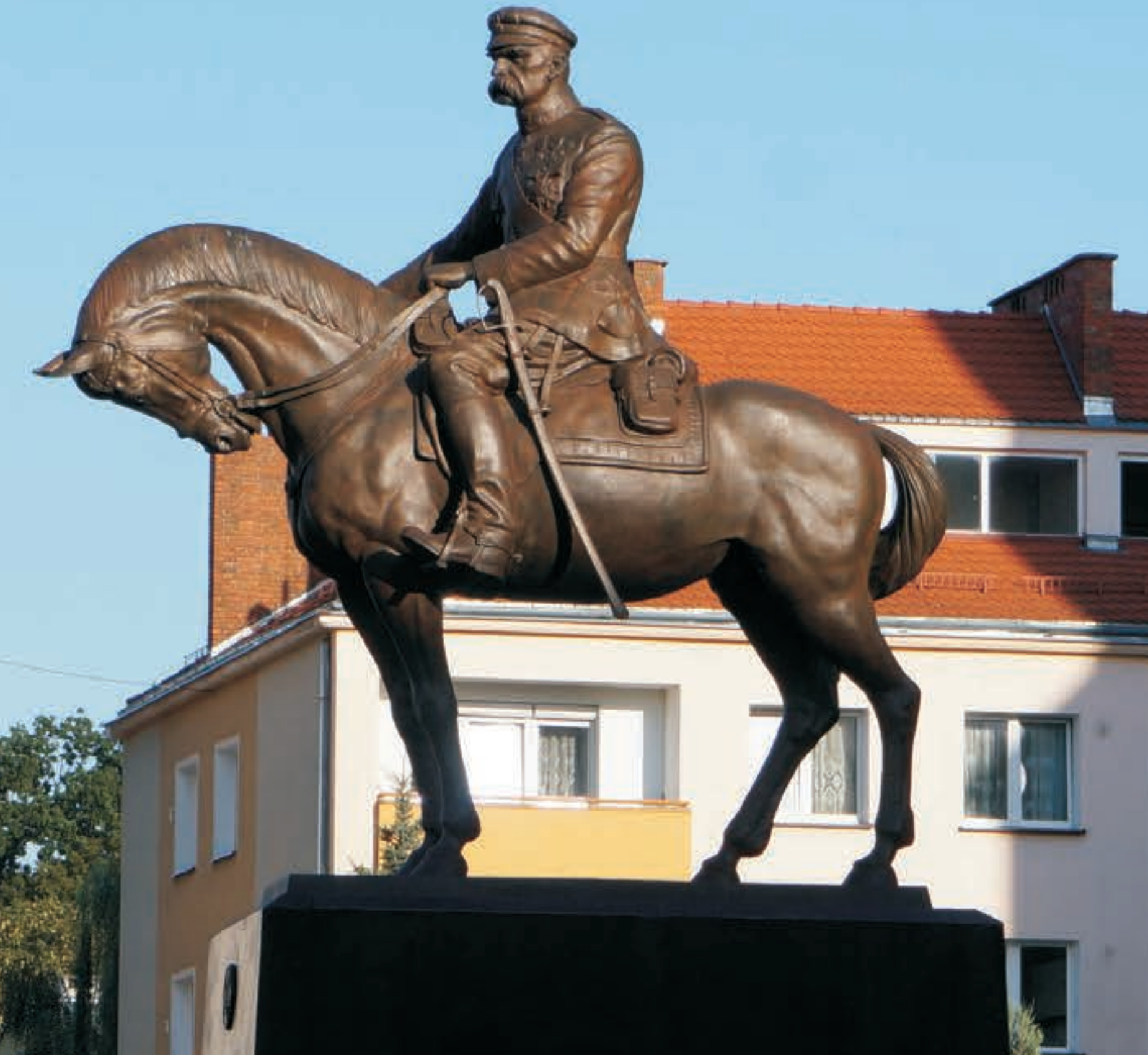
Pomnik Józefa Piłsudskiego postawiony w Nysie w 100-lecie odzyskania niepodległości

Jozef Pilsudski's monument erected in Nysa on the occasion of the centenary of regaining indepeny by Poland