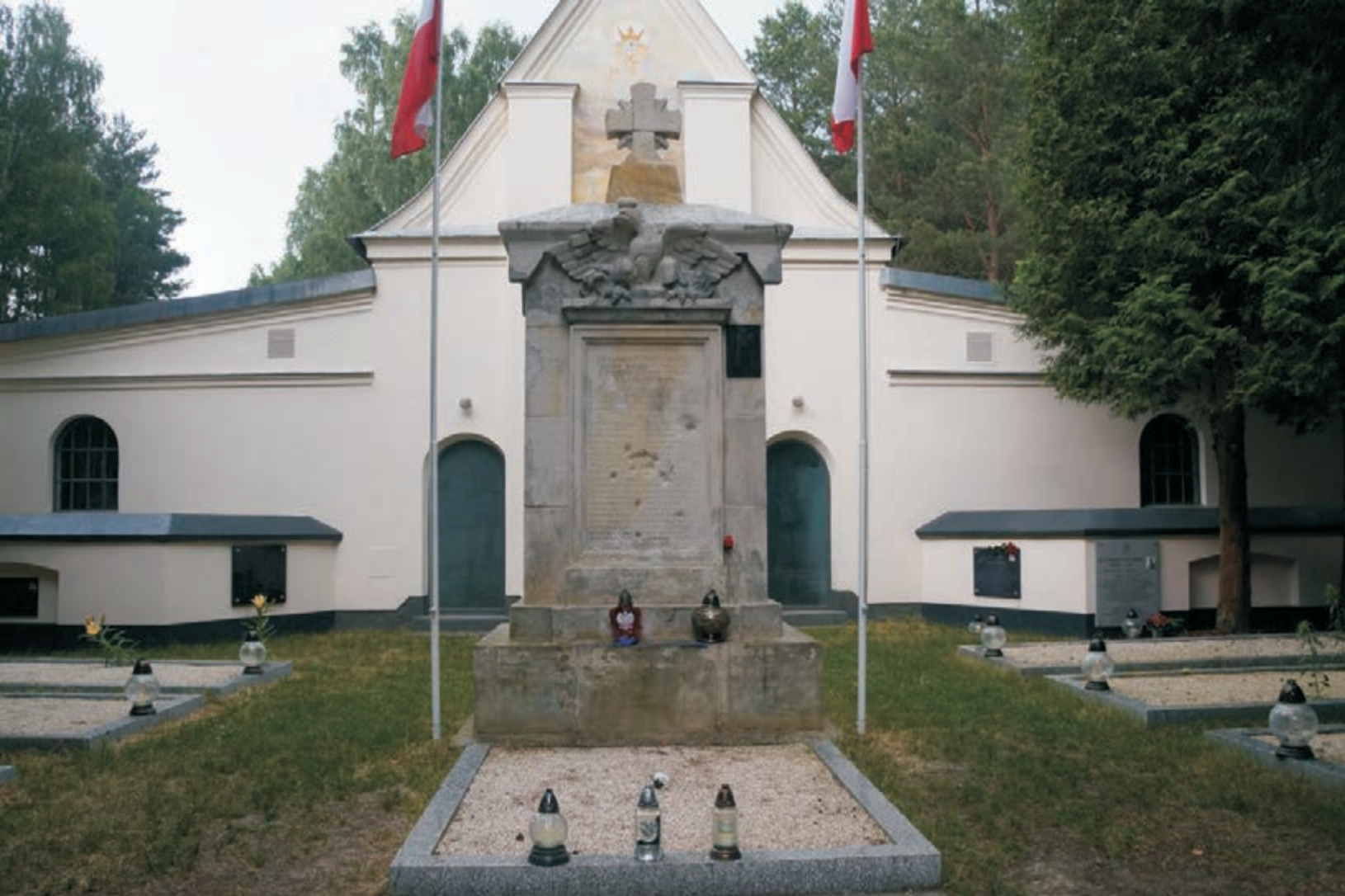
Kaplica i cmentarz w Ossowie. (Poniżej) Pomnik Józefa Hallera Chapel and cemetery in Ossow. (Below) Joseph Haller 's monument