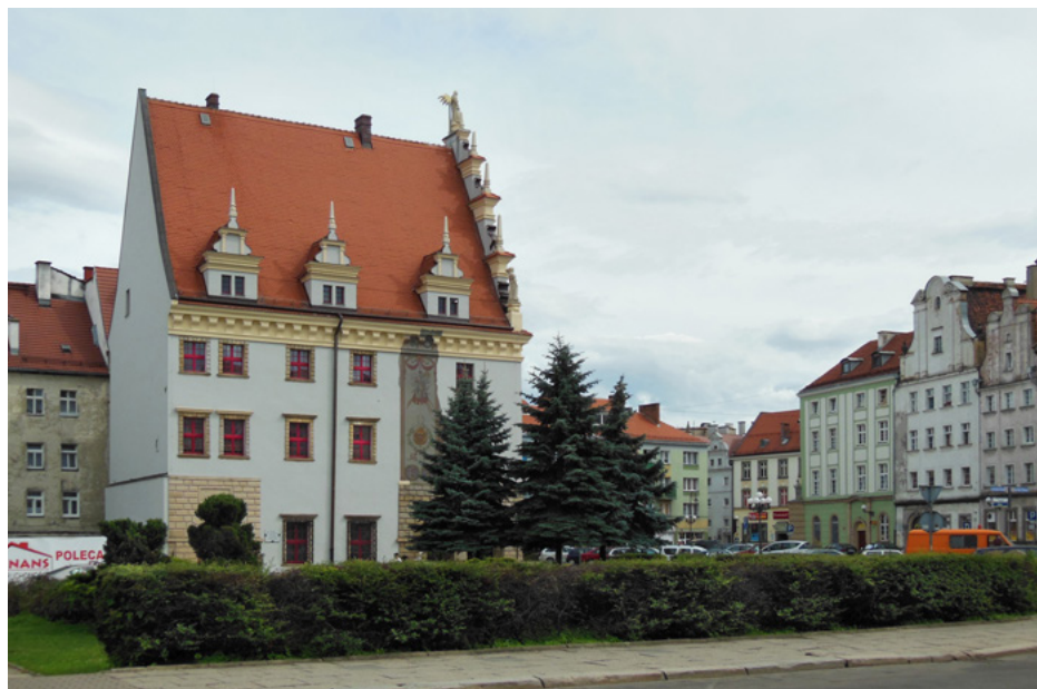
Fot. Jolanta Pol

Kompleksową renowację przeprowadzono w 2011 r.