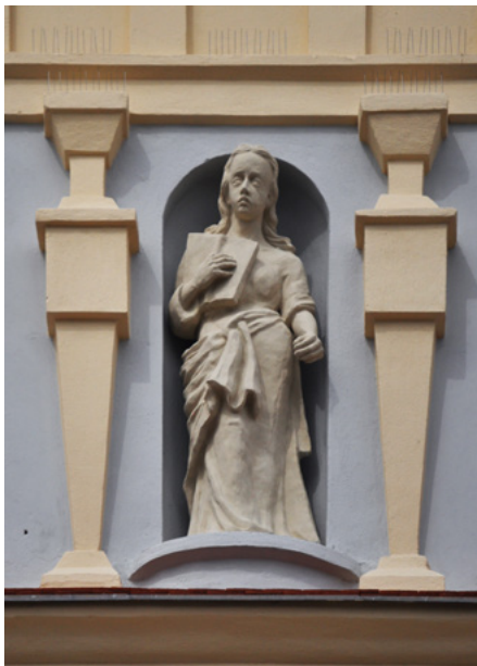
Alegoria Wiary (z Biblią)

Obecnie w budynku mieści się biblioteka.