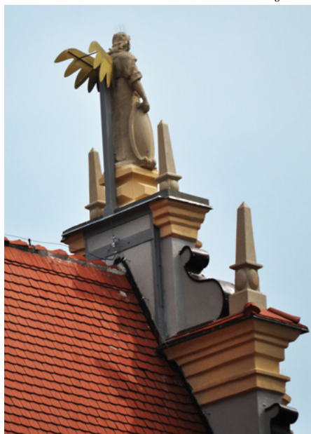
Figura archanioła Michała