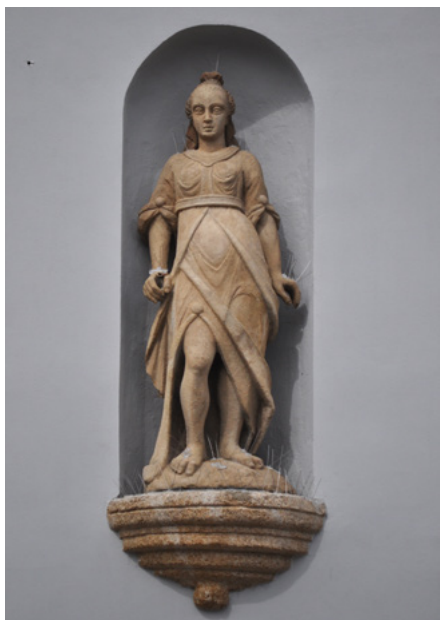
Sprawiedliwość (Justitia) – oryginał

Męstwo (z kolumną), Roztropność – Mądrość (z lustrem)