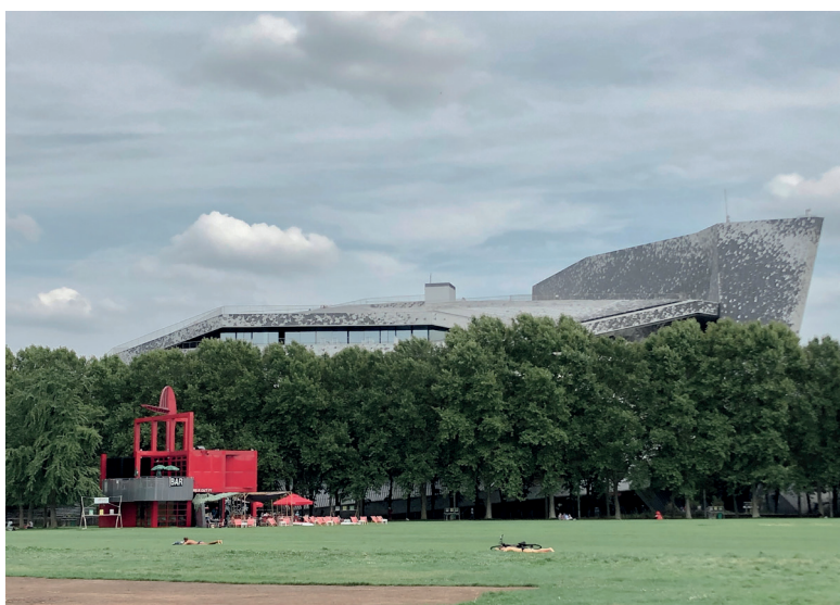
Zdjęcie 2. Philharmonie de Paris, Paryż, Ateliers Jean Nouvel, 2015, widok od strony Parc de la Villette