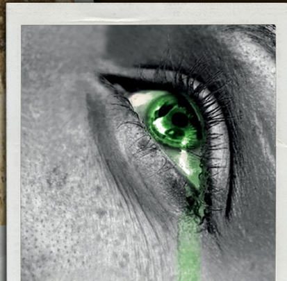
W nadziei na lepsze jutro