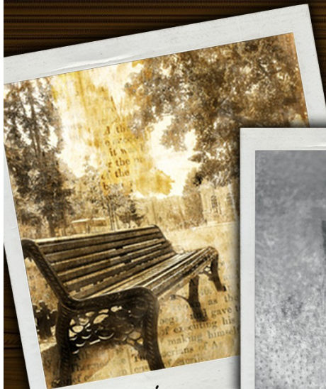
Nieznajomi z parku