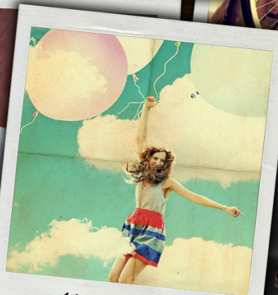
Uwaga na marzenia