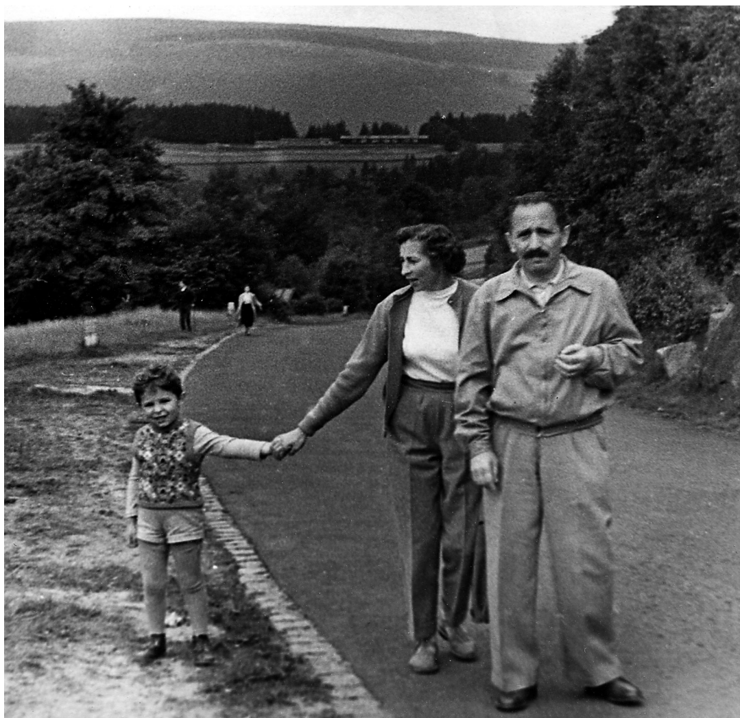
Z rodzicami, 1957