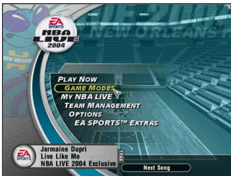
Wystrój menu głównego

Play Now – Ta opcja tradycyjnie już umożliwia rozegranie meczu towarzyskiego. Wybieramy tylko drużyny, które mają naprzeciw siebie stanąć i gramy! Niewątpliwie opcja dobra na początek, gdy poznajemy dopiero realia gry.