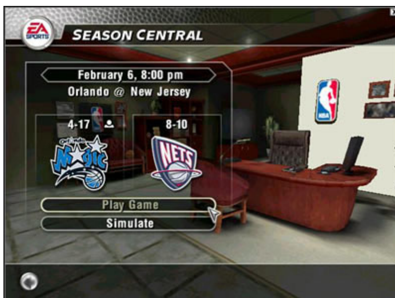
Zaczynamy jeden z meczy w Regular Season

Season Najważniejszy i już wkrótce zapewne najczęściej wykorzystywany przez Ciebie tryb rozgrywki. Tutaj ustawiasz parametry sezonu regularnego, a następnie zaczynasz grę na wzór autentycznych rozgrywek ligi NBA.