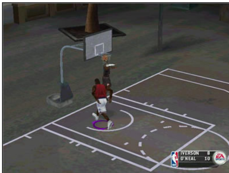
Shaq VS Answer w meczu 1 na 1 to jak pojedynek Dawida z Goliatem