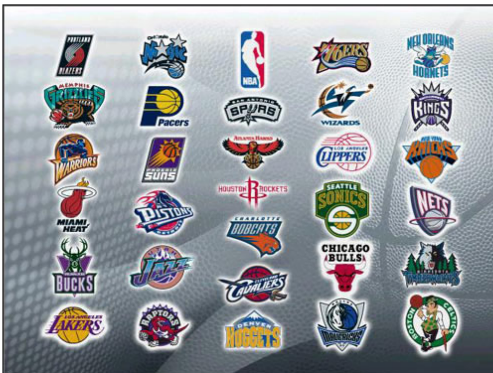
NBA Live 2004 nadciąga!