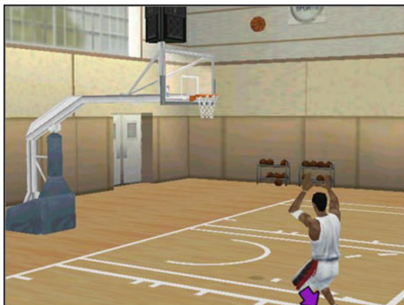
Trening. Ty i kosz - sam na sam

Trening. O ile niezbyt dobrze wychodzą ci elementy gry w ataku; różnego rodzaju rzuty, bądź zwody mające zdezorientować rywala, zawsze możesz na spokojnie poćwiczyć nad tymi elementami tutaj.