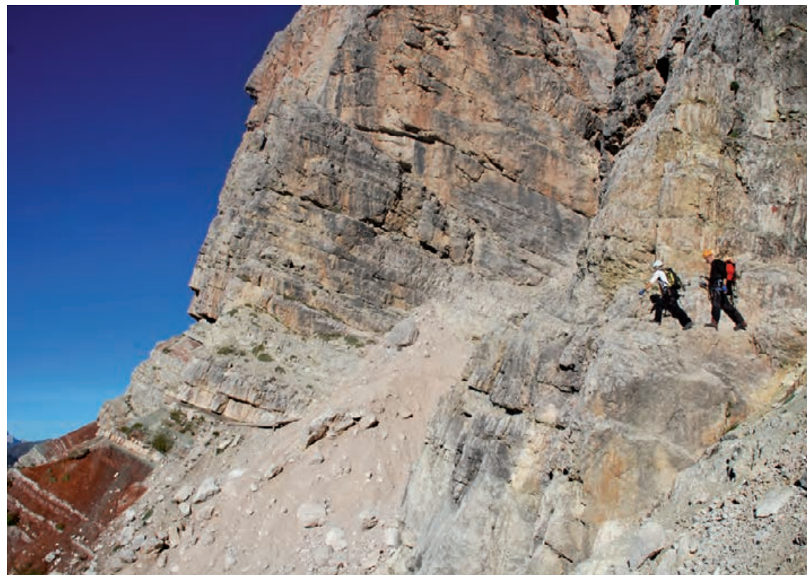
Przejście wśród kolorowych skał

Ze schroniska Rifugio Pomedes zejdz do Rifugio Dibona, kontynuując przejście ścieżką nr 421.