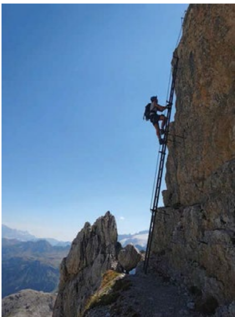
Na ekspozowanej drabinie Via ferraty Piz da Lech