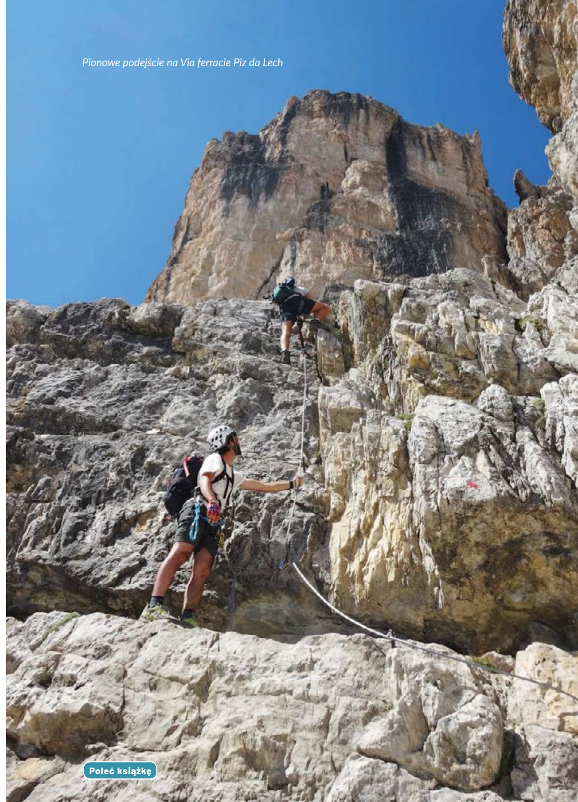
Pionowe podejście na Via ferracie Piz da Lech

łączy Corvarę i Arabbę przez przełęcz Passo Campolongo. W tym przypadku należy uwzględnić dodatkowe 300 m podejścia i 50 min całkowitego czasu marszu.