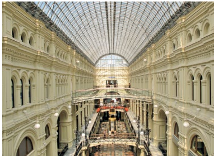
Piękne wnętrze domu handlowego GUM

Budynek przypominający piramidę został wzniesiony w 1930 r. według projektu Aleksieja Szczusiewa jako miejsce spoczynku zabalsamowanego ciała bolszewickiego przywódcy, które od 1924 r. było eksponowane w prowizorycznej drewnianej budowli.