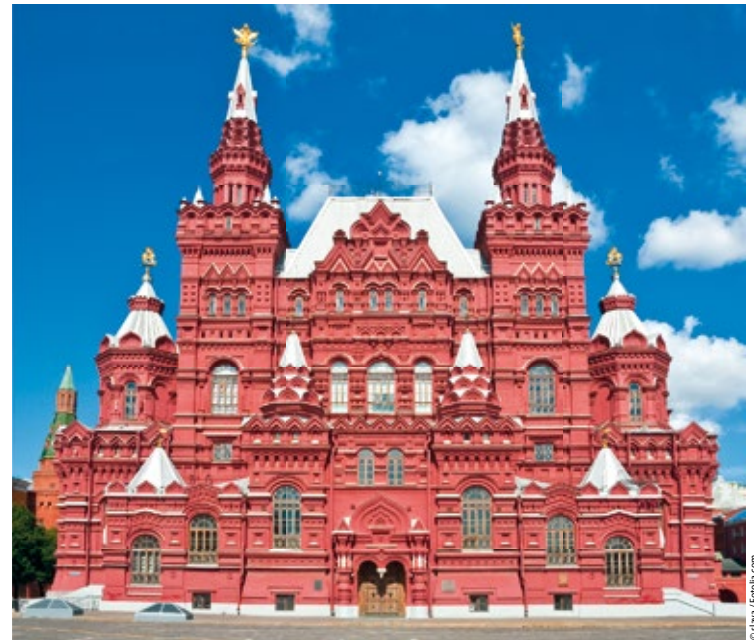
Fasada Państwowego Muzeum Historycznego