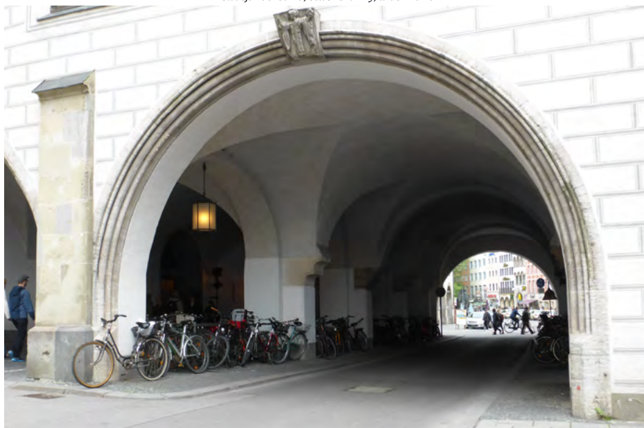
Elewacja zachodnia, otwór bramny, widok na Tal