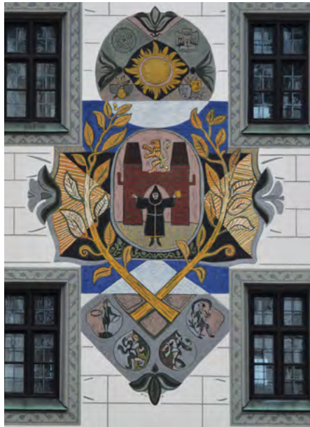
Herb na elewacji zachodniej wieży (Talburgtor), sgraffito