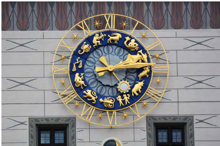
Zegar na wieży (elewacja wschodnia)

Na wschodniej i zachodniej ścianie wieży umieszczono zegary astronomiczne, na południowej – zegar słoneczny.