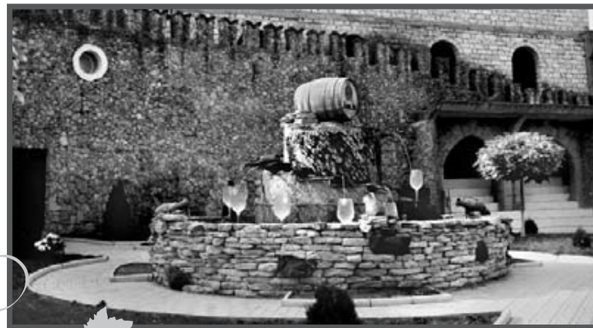
Fontanna z winem

Fontanny były dwie, jedna z winem czerwonym, druga z winem białym. Na samej górze każdej z nich była wielka, piękna beczka, z której „wino” (farbowana