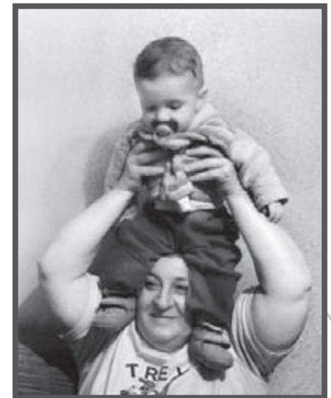
Luda i Edik

Przez trzy lata rząd Polski przysłał do Komratu nauczycielki, żeby uczyły tutejszych języka przodków. W tym roku nie przysłał, bo kryzys. Mieszkanie, które wynajęłam na