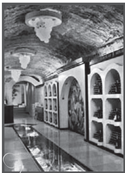
„Monopolowy” w Mileştii Mici

Wizytę w podziemiach dobrze zamówić wcześniej. I dobrze mieć samochód. Na szczęście udaje mi się wcisnąć do auta bogatych „nowych Ruskich”, którzy przyjechali swoimi pojazdami i mieli wolne miejsce. Byli tak nawaleni, że właściwie nie wiem, po co im była jeszcze wizyta w podziemiach, ale przecież byli moimi wybawicielami. Na pytanie, „czy zabiorą mnie ze sobą?”, kiedy jeszcze nie dokończyłam pytania, wielki jak dąb Rosjanin wziął mnie na ręce i powiadomił resztę: „Dziewuszka jedzie z nami!”. Reszta ucieszyła się, że im więcej, tym lepsza zabawa, i ruszyliśmy!