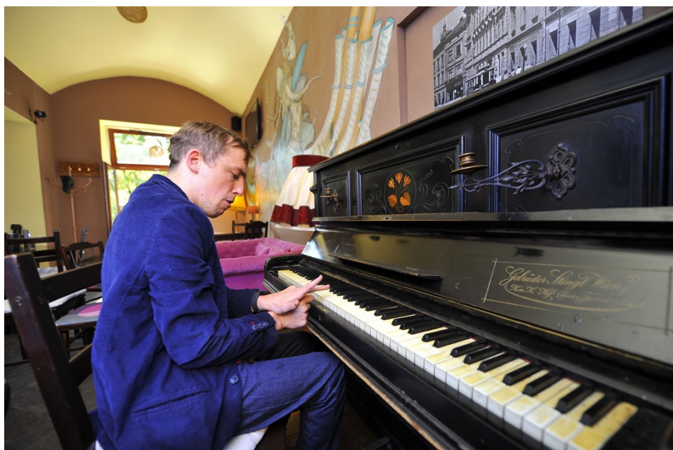
Kraków 2019.