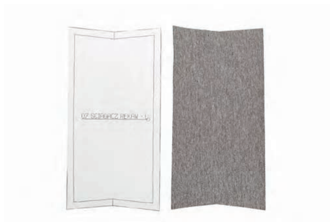
▲ ściągacze do rękawów