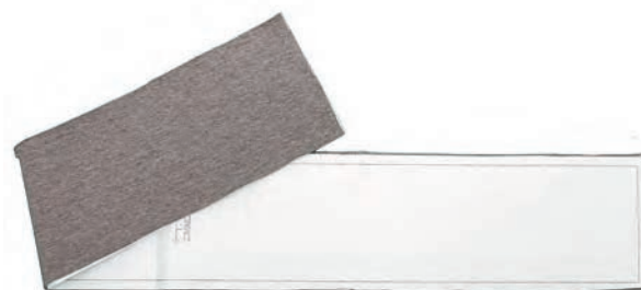
▲ ściągacz dołu