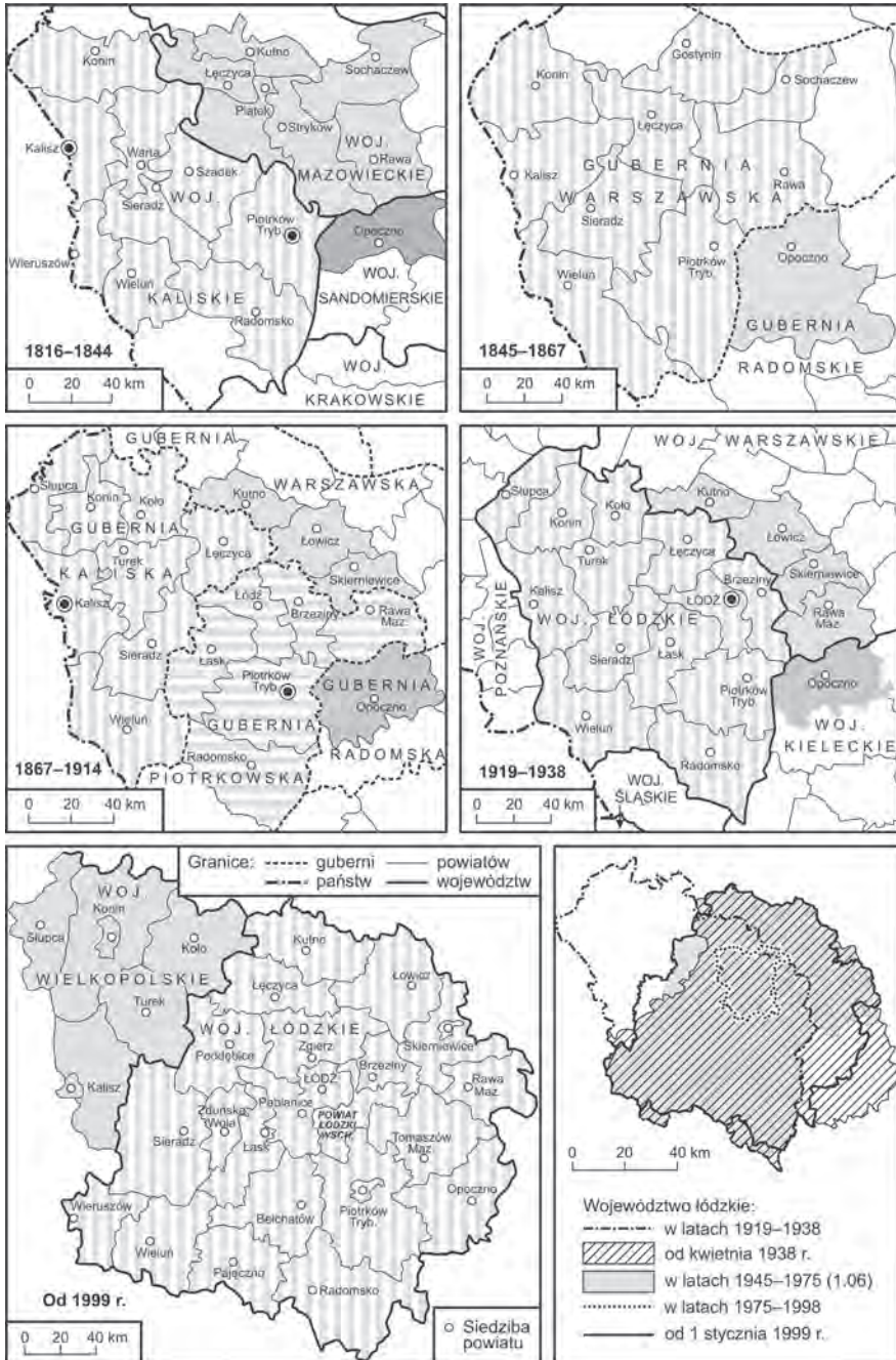
Rycina 1/W. Podział administracyjny Polski Środkowej w latach 1816–1938 i od 1999 roku