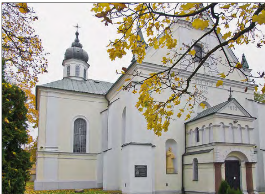
1. Białka Podlaska. Kościół parafialny p.w. św. Anny i kaplica św. Jana Kantego (radziwiłłowska). Stan obecny