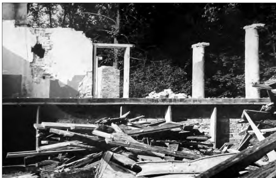
3. Bieliny, dawny dwór Mniszczów, sala w narożu południowo-wschodnim, fot. ze zbiorów Wojewódzkiego Urzędu Konserwatorskiego w Krośnie. Delegatura w Tarnobrzegu, 1988