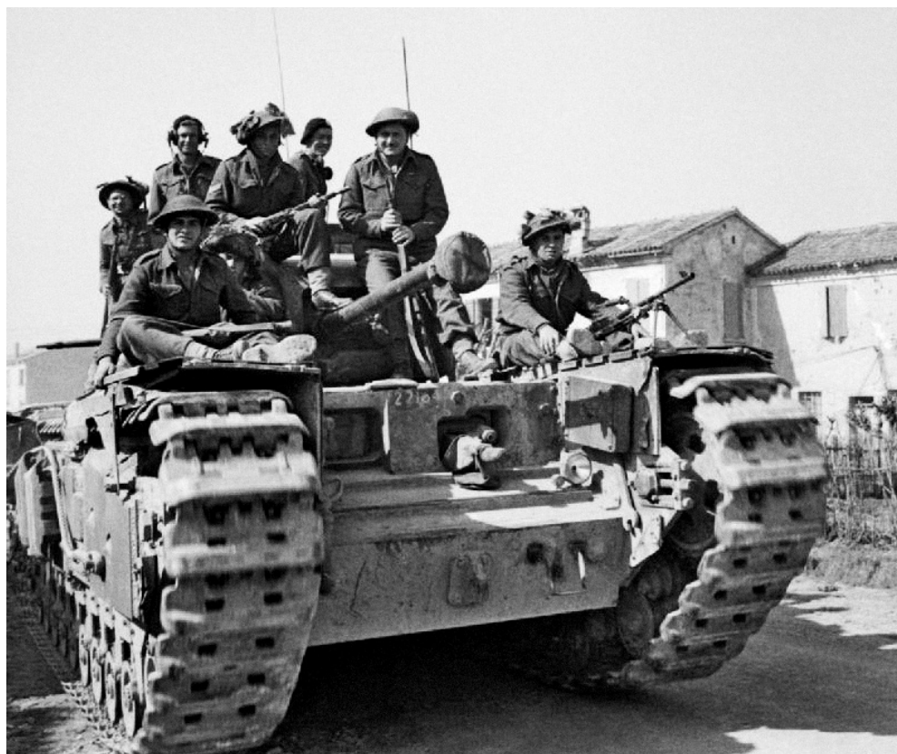
Żołnierze kompanii A z 1. batalionu Brygady Żydowskiej na brytyjskim churchillu.

Sektor Mezzano-Alfonsine, 14 III 1945 r.