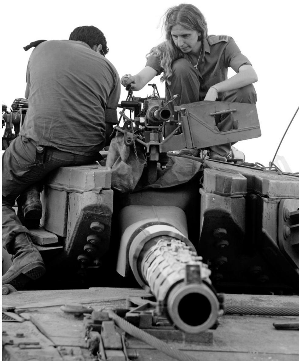
Przygotowanie merkawy do boju w Strefie Gazy, 11 VII 2006 r.