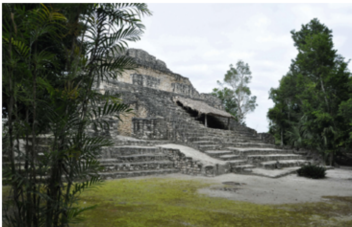
▲ Jedna z majańskich piramid na terenie Chacchoben