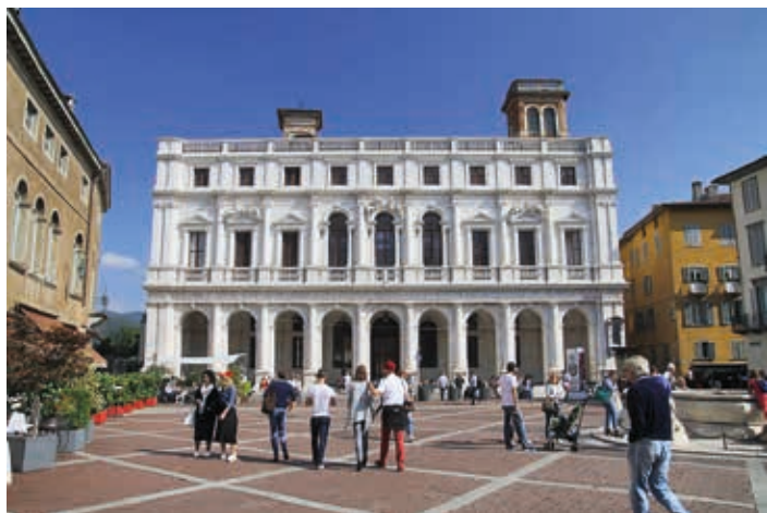
▲ Palazzo Nuovo