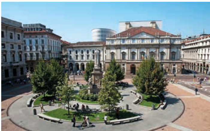
▲ La Scala – najslawniejszy teatr operowy we Włoszech

z prawdziwą pompą. W 1876 r. ukazał się pierwszy numer czołowego włoskiego dziennika „Corriere della Sera”. Szybka industrializacja spowodowała jednak, że robotnicy byli niezadowoleni ze swoich warunków bytowych, co z kolei owocowało licznymi protestami i strajkami.