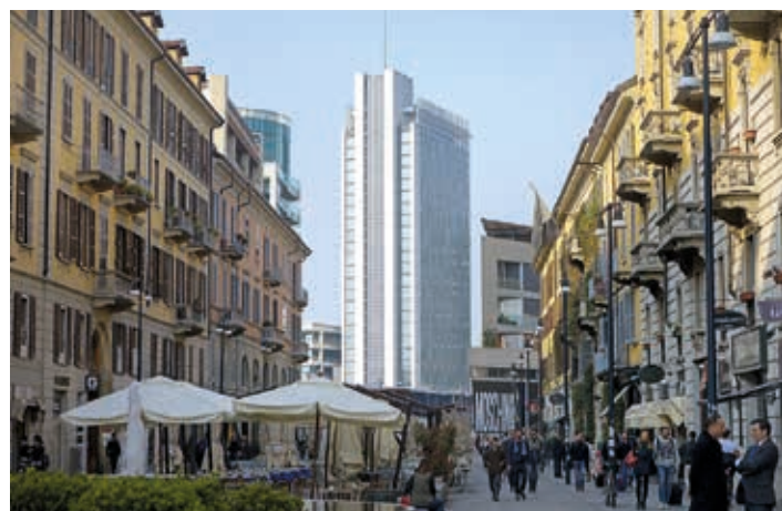
▲ Mediolan łączy stare z nowym – Corso Como

się z tym, czego pragnie przemysł turystyczny. Co godne podkreślenia – takie podejście jest ewenementem na skalę całego kraju.