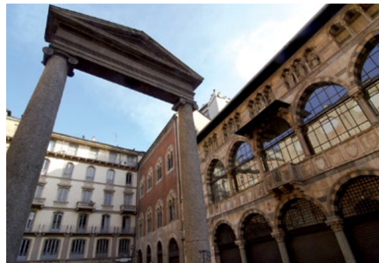
Średniowieczne centrum handlowe – Piazza dei Mercanti

Nad piazza Cordusio , ruchliwym skrzyżowaniem, góruje okazały i eklektyczny pałac, w którym mieści się siedziba towarzystwa ubezpieczeniowego Generali. Via Cordusio można dojść do piazza Edison, a stamtąd via della Posta do piazza Affari . W mediolańskim „City” – finansowej stolicy Włoch, która pustoszeje w każdy weekend – królują ogromne budynki. Na uwagę zasługuje pałac, w którym mieściła się kiedyś siedziba Banco di Roma (1941 r., obecnie Unicredit), jego czysta forma kontrastuje z bogato zdobionym gmachem Banca d'Italia, zbudowanym w latach