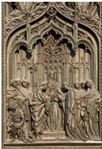
Misternie zdobione drzwi katedry

Dawny pałac królewski został wzniesiony w XVIII w. wg projektu Giuseppe Piermariniego , zakładającego włączenie do budowli licznych gotyckich pozostałości starego pałacu książęcego. Na szczególną uwagę zasługuje pokazna Sala delle Cariatidi (Sala Kariatyd), niewyremontowana od czasów wojny. W pałacu organizowane są wielkie wystawy sztuki.