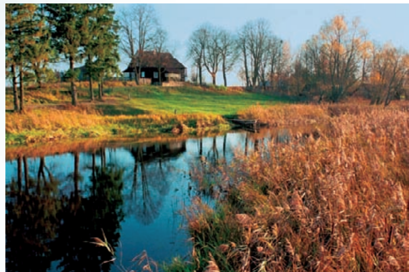
Krutynia, ulubiona rzeka kajakarzy