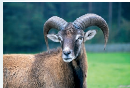
Mouflon na farmie w Kosewie