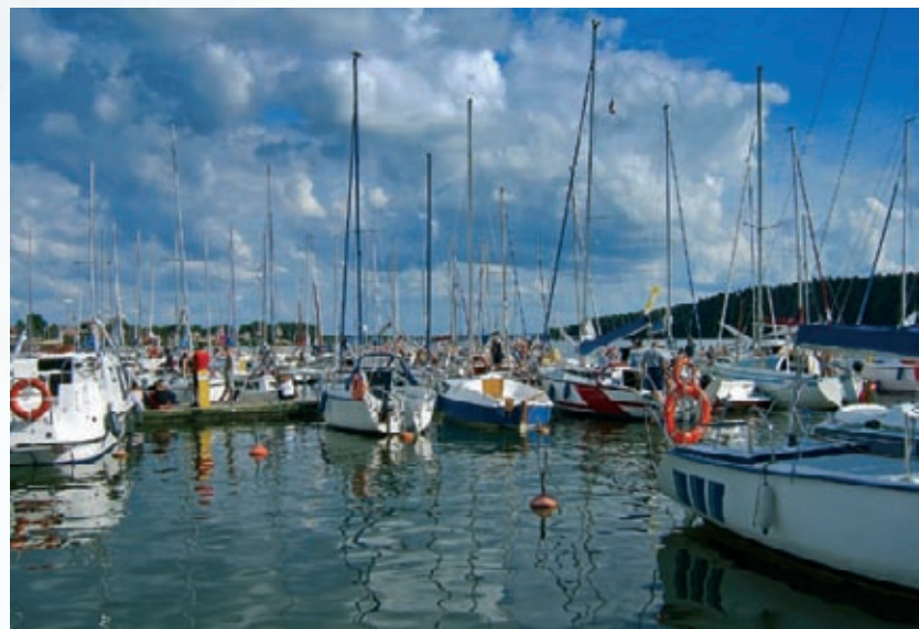
Mikołajki – miasto patrona żeglarzy