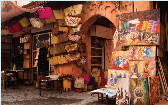
Sklepy z wyrobami rzemieślniczymi

Zanurzenie się w kulturze gnawa przez muzykę i sztukę z As-Suwajry, które oddają niezwykłą atmosferę dawnego Mogadoru. W fascynującej sztuce, bliższej abstrakcji, mieszają się wpływy lokalne i tradycje berberyjskie (zob. s. 88, 89).