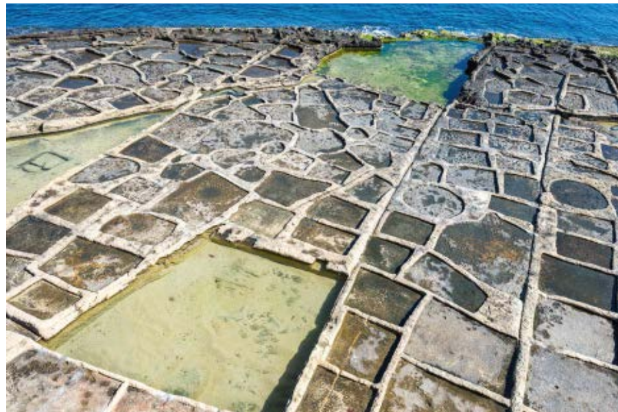
▼ Saliny – płaskie baseny, w których produkuje się sól z morskiej wody w okolicy Marsaskali

Marsaskala była spokojnym portowym miasteczkiem. Ludzie kupowali w tej okolicy letnie rezydencje, a ostatecznie przenieśli się na stałe. Wskutek tych przemian miejscowość stała się kurortem, w którym obecnie wznoszą się nowoczesne hotele. Jednak herb miasteczka oraz jego flaga wciąż przypominają o sielankowej przeszłości Marsaskali. Emblematem miasta są dwa zielone trójkąty, tworzące obraz przypominający stromą dolinę, między którymi umieszczono rysunek niebiesko-białych fal. Marsaskala leży bowiem w dolinie, a morze bardzo głęboko wcina się w ląd.