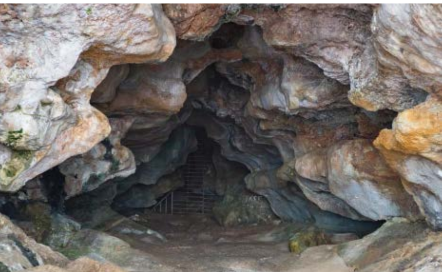
▼ Jaskinia Ghar Hasan