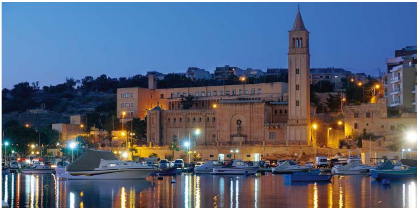
▲ Port w Marsaskali

W XIX w. zamieszkało na tym terenie nieco więcej osadników, być może za sprawą pojawiających się wiosną rzek. Stąd wzięła się nazwa Wied il-Ghajn , używana przez miejscowych do dzisiaj. Oznacza ona