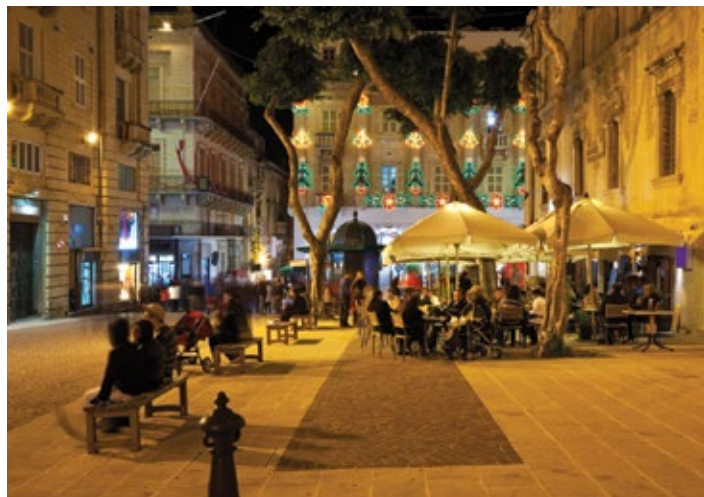
▲ Nocne życie Valletty

Podążając dalej, także po lewej stronie, zobaczymy budynek ★ Narodowego Muzeum Archeologicznego i Auberge de Provence, Republic Street; www.heritage-malta.org; czynne: codz. 9.00–19.00; wstęp: dorośli 5 EUR, studenci i seniorzy 3,50 EUR , w którym można zapoznać się przede wszystkim z opisami i planami maltańskich świątyń megalitycznych oraz historią ich odkrycia. Możemy tu również podziwiać najświeższą figurkę znaną na Malcie – Śpiącą Wenus lub też Śpiącą Kapłankę, przeniesioną do muzeum z hypogeum Hal-Saffieni, które znajduje się w dzisiejszej Paoli, niedaleko Valletty. Inną figurką prezentowaną na wystawie jest Maltańska Wenus znaleziona na terenie stanowiska archeologicznego w Haġar Qim. Z pozostałych obiektów przeniesionych do muzeum warto zwrócić uwagę na bloki kamienne z wyrzeźbionymi zwierzętami oraz motywami roślinnymi pochodzące ze