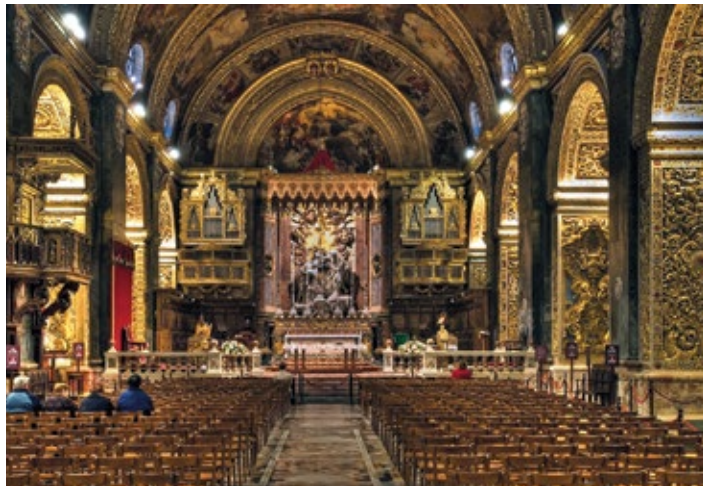
▲ Wnętrze konkatedry św. Jana w Valletcie

o takiej konstrukcji można zobaczyć w każdej maltańskiej miejscowości. Pomimo niezbyt efektownego wyglądu zewnętrznego, wnętrze świątyni zachwyca barokowymi zdobieniami i złoconiami. Duże wrażenie na zwiedzających wywiera marmurowa podłoga pokryta kolorowymi płytami nagrobnymi. Barokowy wystrój wnętrza kościoła powstał w XVII w. Zakon sfinansował jego przebudowę, a wielu rycerzy ofiarowało cenne dary.