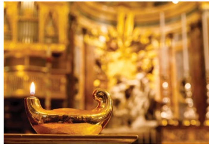
▲ W konkatedrze św. Jana w Valletcie

zakonników. Zakon rycerzy św. Jana był bowiem podzielony na tak zwane „języki” ( langues ), w zależności od pochodzenia danej grupy braci. Ostatnim pomieszczeniem po lewej stronie jest zakrystia, która została zbudowana w 1598 r., a z biegiem czasu dodano do niej nowe elementy. W 1758 r., za rządów Wielkiego Mistrza Manuela Pinto, została odnowiona.