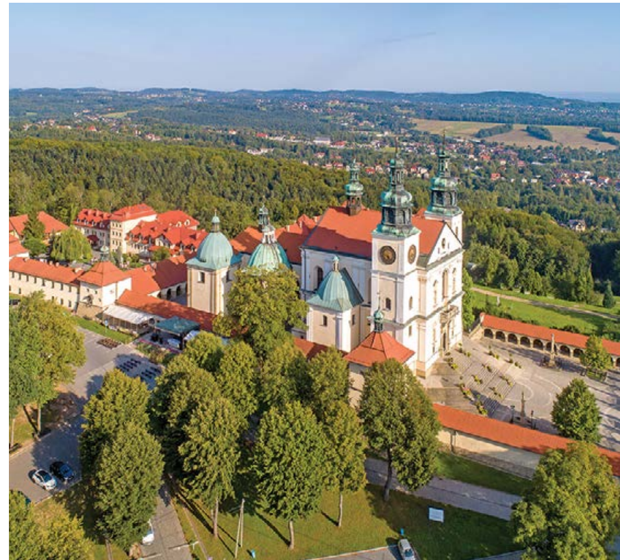
▲ Sanktuarium maryjne w Kalwarii Zebrzydowskiej