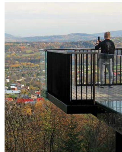
▲ Leśne Molo na Miejskiej Górze

Można również wybrać się na dłuższą wycieczkę, bo na Miejskiej Górze wytyczono też dwie inne ścieżki spacerowo-rowerowe, tworzące pętlę: małą (długości ok. 2 km), wiodącą głównie grzbietem wzgórza, oraz dużą, która wymaga podejścia po bardziej stromych zboczach (ok. 3 km).