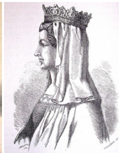
1–2. Królowa Danii, Norwegii i Szwecji Małgorzata I

gorzata (forma najczęściej występująca, 1393), Margarzeta (1394), Margorzeta (1397), Margorzeta (1397), Margarzeta (1400), Mangorzata (1410), Małgorzata (1422), Margarzata (1425), Małgorzata (1452).