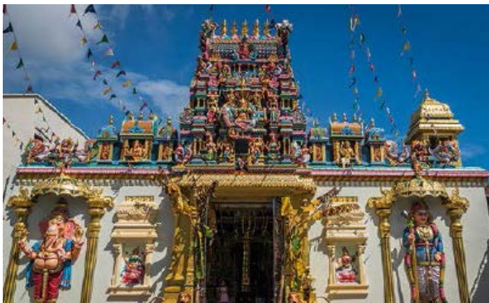
▲ Świątynia hinduistyczna Sri Mahamariamman