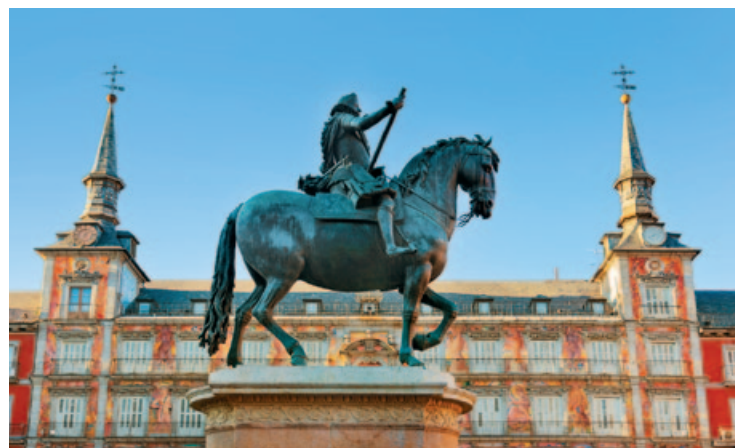
Konny pomnik Filipa III

Calle Mayor, biegnąca za północną ścianą Plaza Mayor i łącząca Puerta del Sol z Pałacem Królewskim, była niegdyś główną arterią Starego Miasta. W niewielkiej kamienicy pod nr. 61 mieszkał Pedro Calderón de la Barca , a pod nr. 59 mieściła się apteka Królowej Matki (małżonki Filipa V).