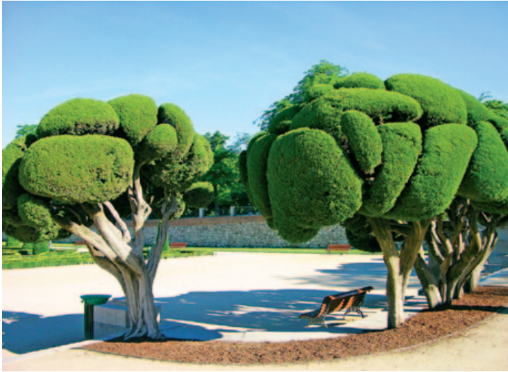
Salon pod gołym niebem – Parque del Retiro

jest niespotykana, panująca w nocy żywiołowość. Niewyczerpana energia do zabawy jest z pewnością największą atrakcją, jaką stolica zapewnia przyjeżdżającemu tutaj turystyce, któremu nie pozostaje nic innego, jak tylko poddać się temu na przemian leniwemu i nieokielznanemu rytmowi życia.