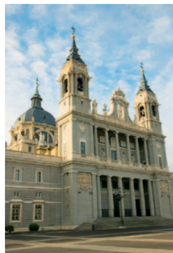
Na drugim planie widoczna jest słynna kopuła Katedry Matki Boskiej Almudeny

Obecnie król i królowa nie mieszkają w Palacio Real, odbywają się tutaj jedynie oficjalne ceremonie.