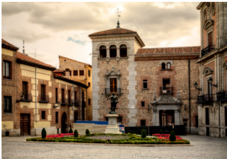
Spokojny i przyjemny plac – Plaza de la Villa

Instituto Italiano di Cultura (Włoski Instytut Kultury w Madrycie, pod nr. 86) zajmuje XVII-wieczny budynek zmodernizowany w późniejszym okresie. Naprzeciwko wznosi się dawny pałac diuka de Uceda (Palacio del duque de Uceda) z tej samej epoki, aktualnie siedziba I Okręgu Wojskowego w Madrycie (Capitania General). Budynek z cegły i granitu jest typowym przykładem miejskiej architektury tamtych czasów. Przed kościołem Arzbispał-Castrense (XVII–XVIII w.) znajduje się pomnik , upamiętniający wszystkich, którzy zginęli podczas zamachu na Alfonsa XIII w 1906 r., w dniu jego ślubu z przyszłą królową Wiktorią Eugenią.