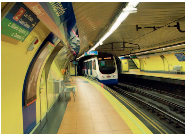
W czasie podróży – madryckie metro

z XVII w. oraz przede wszystkim studnia , z której święty cudem uratował swojego syna. Podczas zwiedzania można poznać historię stolicy w oparciu o odkrycia archeologiczne (od prehistorii, przez epokę romańską, muzułmańską, aż do madryckiego Złotego Wieku).