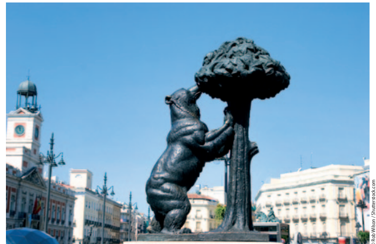
Niedźwiadek na Puerta del Sol

Unikajmy restauracji na Plaza Mayor – nastawionych głównie na turystów i przez to drogie. Koniecznie trzeba odwiedzić Królewski Klasztor Klarysek (Monasterio de las Descalzas Reales, zob. niżej).