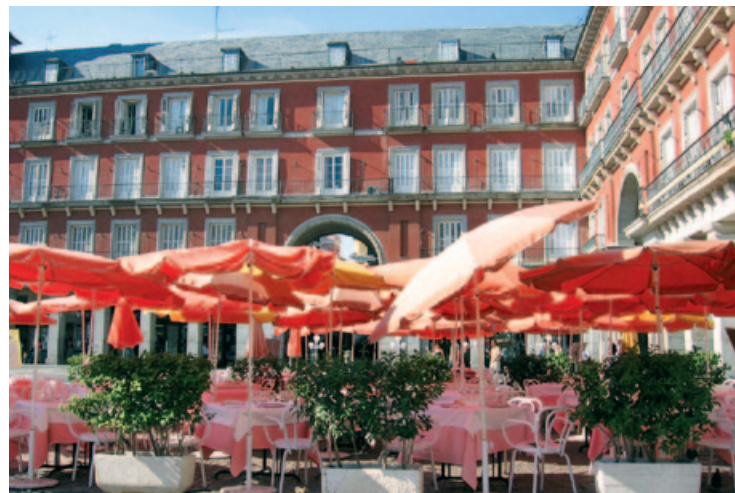
Kawiarnia na Plaza Mayor

W niedzielne poranki na placu odbywa się targ znaczków pocztowych i monet, a w okresie Bożego Narodzenia rozkładane są stragany, na których sprzedaje się świąteczne dekoracje.