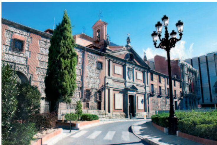
Królewski Klasztor Klarysek

W górnej galerii klasztornej znajdują się 33 kaplice , które prześcigają się w przepychu. Szczególnie piękne są dwa wnętrza: jedno poświęcone Matce Boskiej z Guadalupe (barok) oraz drugie z XVI-wieczną rzeźbą Leżącego Chrystusa , dłuta Gaspara Becerry. W wielu ogólnodostępnych salach na antresoli można podziwiać liczne portrety członków rodziny królewskiej pędzla Petera Paula Rubensa, Alonso Sáncheza Coello, Luisa de Moralesa, Juana Pantoji de la Cruz, Świętego Franciszka Francisco de Zurbarána, Pokłon Trzech Króli Pietera Bruegla starszego, Grosz czynszowy Tycjana, Madonnę z dziećmi Moralesa, kilka dzieł Pedro de Meny ( Matka Boska Bolesna i Ecce Homo ) oraz Gregorio Hernández (Magdalena).