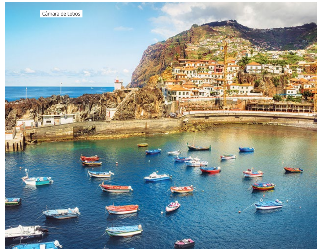
Câmara de Lobos

Kiedy odkrywca Madery João Gonçalves Zarco wraz z żeglarzem Tristão Vaz Teixe- irą przybili do małej zatoczki na południu Madery, zobaczyli na jej brzegu kolo- nię mniszek śródziemnomorskich, po portugalsku nazywanych lobos marinhos (dosłownie: wilki morskie). Zarco ochrzcił to miejsce Câmara de Lobos (czyli Izba Wilków) i tak właśnie nazywa się ta przepiękna miejscowość. W porcie można zobaczyć ciekawy mural portugalskiego artysty Bordala II, nawiązujący do tych niezwykłych zwierząt, który jest częścią większego projektu Big Trash Animals – jego celem jest zwrócenie uwagi na ochronę ginących gatunków zwierząt. Sztuka tego artysty sygnalizuje również problem zanieczyszczenia oceanów, dlatego też jako instalacje powstają ze śmieci wyrzuconych przez ocean. Na Maderze jest kilka prac Bordala II, ale można je zobaczyć na całym świecie, również w Polsce.