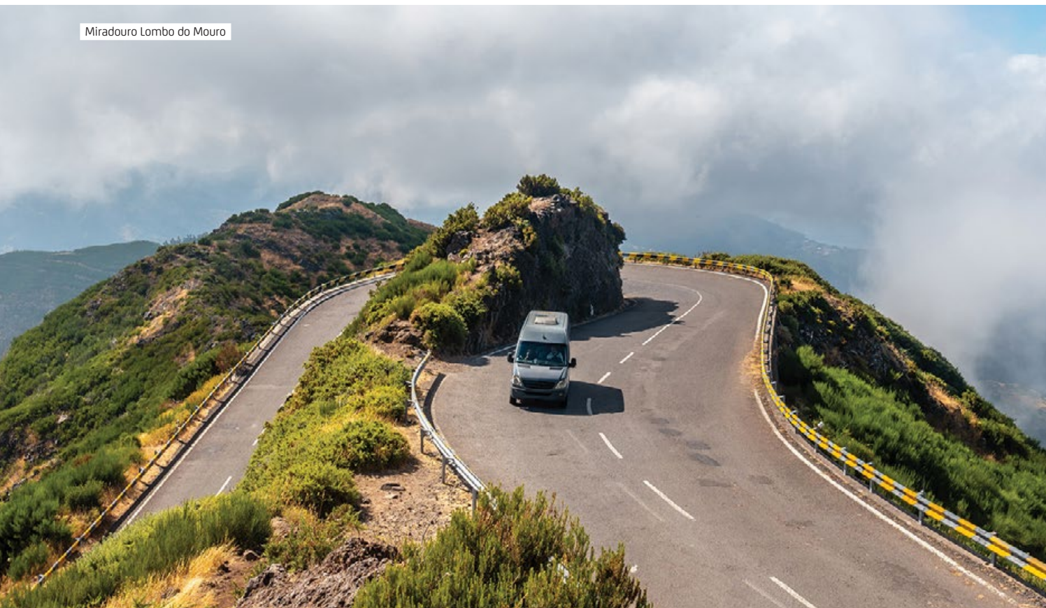
Miradouro Lombo do Mouro

Folhadal, przez który przebiega część trasy, to jeden z obszarów Madery o najwyższej wilgotności. Rośliny chłoną tu wodę nie tylko z deszczu, ale przede wszystkim z mgły. Las laurowy w tej części wyspy „produkuje” nawet do kilku tysięcy litrów wody na hektar... w zaledwie jeden dzień! To właśnie dzięki temu naturalnemu zjawisku Madera ma tak rozbudowany system lewad.