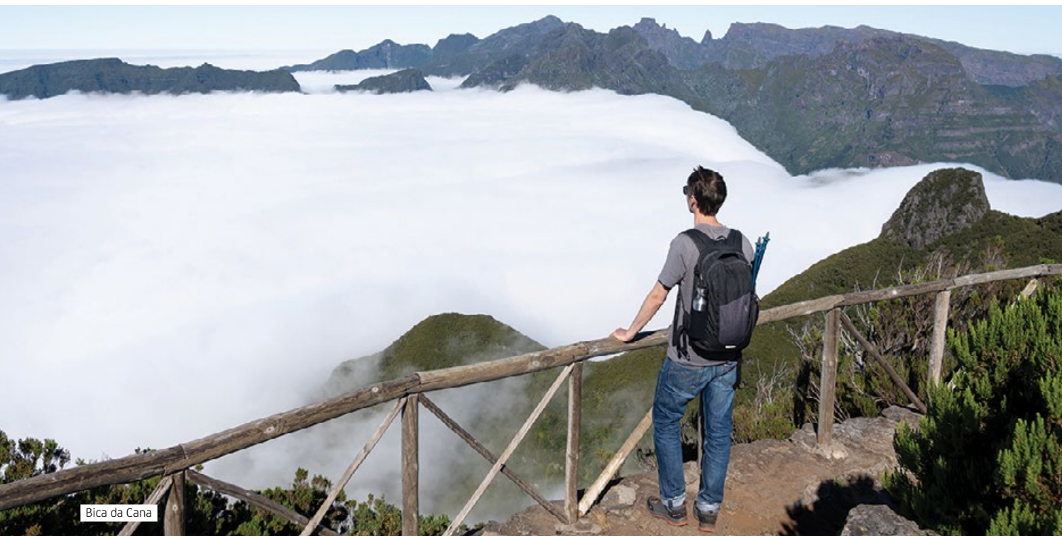
Bica da Cana

Dalej leśna ścieżka prowadzi w dół. Docieramy do małych schodków i wychodzimy na szeroką drogę, gdzie drogowskaz wskazuje, że należy iść na prawo. Odbijamy więc według oznaczenia i zaledwie po 100 m kolejny znak nakazuje skręcić ostro w prawo. Wchodzimy po raz kolejny w głąb lasu. Po chwili marszu ścieżka po lewej stronie prowadzi do opuszczonych domków. To Casa do Caramujo, tradycyjne wiejskie zabudowania. Jeszcze sto lat temu pełniły funkcję domów dla pracowników rolnych oraz strażników lewad. Obecnie stoją puste, ale wciąż przypominają o tradycji wyspy.