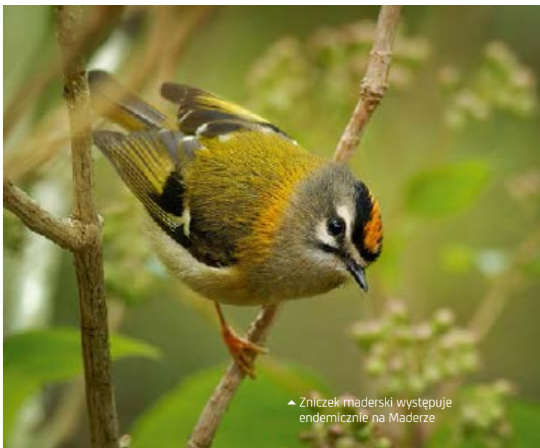
▲ Znićzek maderski występuje endemicznie na Maderze

szosą ER 101, gdzie zobaczymy dawne, wydrążone w skale tunele . Po drodze trafimy w wyjątkowe miejsce: pod wodospad Cascata dos Anjos . To wielka atrakcja i niecodzienny przerywnik w zwiedzaniu. Woda spada tu prosto na jezdnię, po której można przejechać i... skorzystać z naturalnej myjni samochodowej! Nie należy jednak zatrzymywać się bezpośrednio pod samym wodospadem, ponieważ czasem wraz z wodą spadają odłamki skalne, które mogą uszkodzić auto. Można też często spotkać tu turystów korzystających z bezpośredniej kąpieli, nie jest to jednak zbyt bezpieczne ze względu na wspomniane kamienie. Czasami bywa nawet tłoczno – każdy chce mieć ciekawą pamiątkę i wyjątkowe ujęcie z tego miejsca. Do wodospadu prowadzi malownicza droga wzdłuż wybrzeża oceanu. Jeśli chcemy zobaczyć Cascata dos Anjos z bliska, samochód można zostawić trochę dalej, gdzie droga jest szersza.