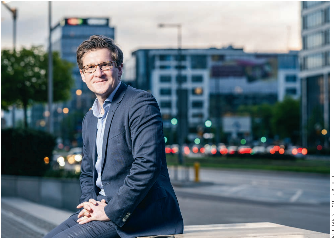
MIROSLAW STELMACH / REPORTER