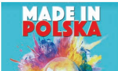
Projekt okładki MAREK K. ZALEJSKI / ADOBE STOCK