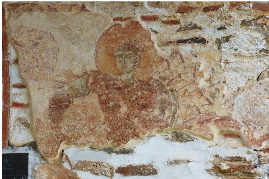
Polichromie na fasadzie (elewacja zachodnia)

Na zewnątrz, od zachodu i południa, zachowały się niewielkie fragmenty fresków. Pochodzą z czasów budowy świątyni.