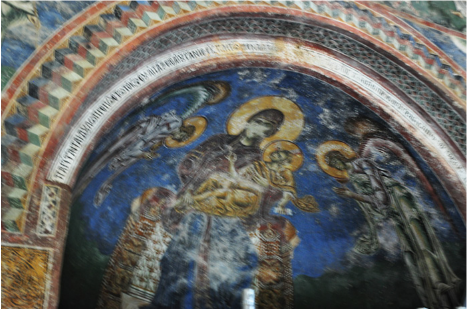
Absyda – wizerunek Maryi z Dzieciątkiem i archaniołów Michała i Gabriela Ściana wschodnia (z lewej też ściana północna)

Freski z Kurbinowa są rzadkim, a zarazem wybitnym przykładem wczesnośredniowiecznej sztuki bizantyńskiej.