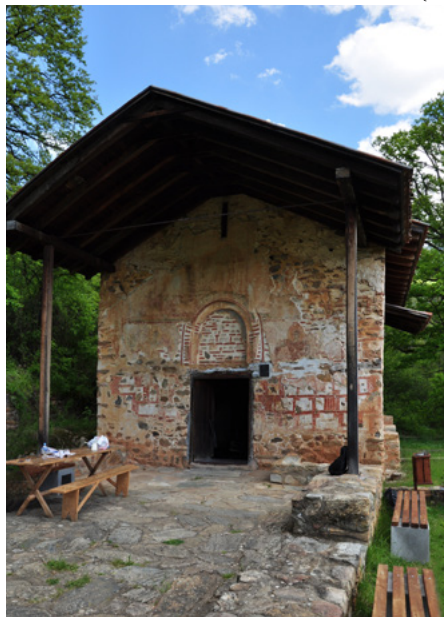
Fasada (elewacja zachodnia)