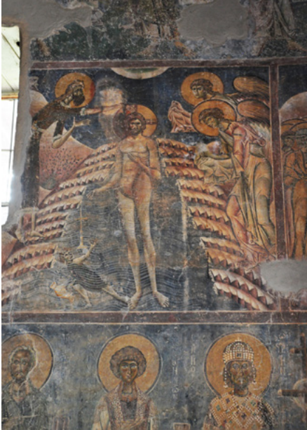
Ściana południowa, chrzest Jezusa

Wnętrze całe pokryte jest freskami. Powstały w tym czasie kościół, ale jest też kilka późniejszych.