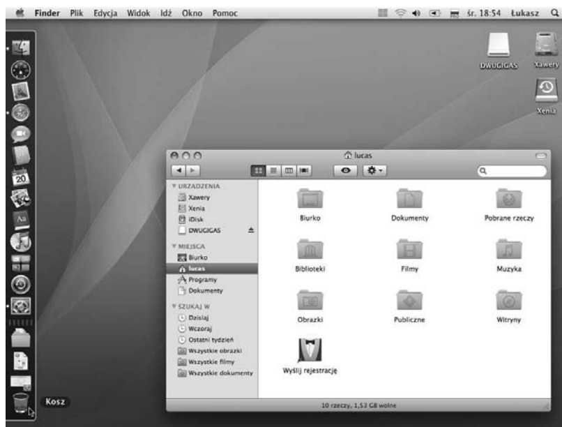
Rysunek 5.9. Pasek Docka, umieszczony przy lewej krawędzi ekranu

po prawej, jeżeli masz zamiar umieścić go przy prawej krawędzi. Pionowy pasek Docka, wyświetlany przy lewej krawędzi ekranu, został przedstawiony na rysunku 5.9.