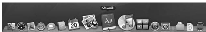
Rysunek 5.8. Powiększanie elementów Docka

Dock pozwala na ustawienie powiększania ikon w momencie umieszczenia nad nimi wskaźnika myszy. Efekt działania tej funkcji został pokazany na rysunku 5.8. Aby móc skorzystać z tej możliwości, należy wybrać odpowiednie ustawienie, używając menu Jabłko .