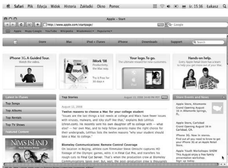
Rysunek 5.3. Uruchomiona przeglądarka Safari