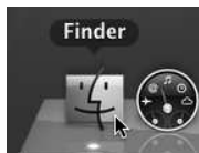
Rysunek 5.2. Nazwa programu wskazywanego przez skrót w Docku