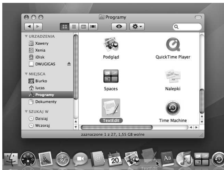
Rysunek 5.6. Przeciąganie elementu do Docka