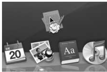
Rysunek 5.7. Usuwanie skrótów programu z Docka