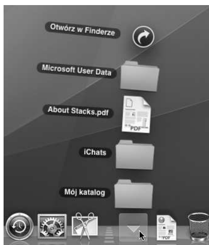
Rysunek 5.5. Efekt kliknięcia ikony stosu