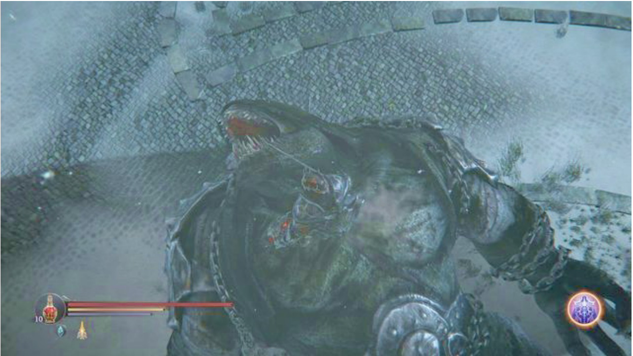
Piękny i Bestia - prawie jak w bajce.

Poradnik do gry Lords of the Fallen został przygotowany w oparciu o podstawową wersję gry. Opis dotyczy także pierwszego ukończenia przygody - w momencie kontynuowania rozgrywki (Nowa gra+, a dalej Nowa gra++) w grze mogą pojawić się nowe, niemożliwe do zdobycia wcześniej przedmioty. Główna oś fabuły, lokalizacja przedmiotów fabularnych oraz zadań pobocznych nie ulega jednak zmianie. Niektóre notatki natomiast można znaleźć tylko podczas kontynuowania rozgrywki już po jej zakończeniu. W skrzyniach możesz także znaleźć nieco inne przedmioty (różnice te będą dotyczyły głównie Okruchów ), zależnie od poziomu cechy Szczęście . Podobnie jednak, położenie znajdujących zbroi oraz broni nie ulega zmianom (w kilku przypadkach możesz jednak zdobyć inną zbroję, zależnie od wybranej początkowo klasy).