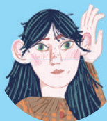
Sara Crewe 173