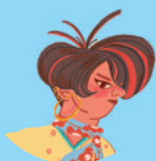
Majka Skowron 101