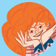
Ida Borejko 53