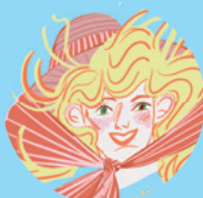
Ewa Tyszowska 35