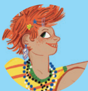
Pippi Pończoszanka 155