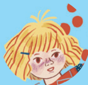
Łucja Pevensie 95