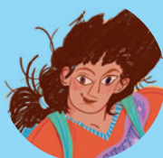
Mireille Laplanche 143