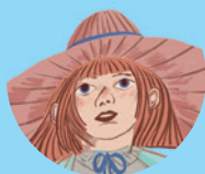
Mary Lennox 119