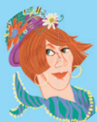
Mary Poppins 125