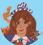
Hermiona Granger 47