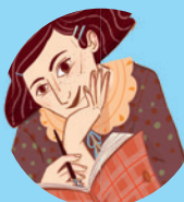
Anne Frank 29