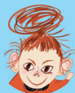
Mała Mi 113