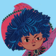
Malutka Czarownica 107