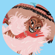
Pchła Szachrajka 149