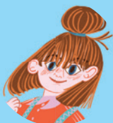
Matylda Wormwood 137