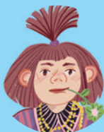
Lusja Czerska (Figa) 89