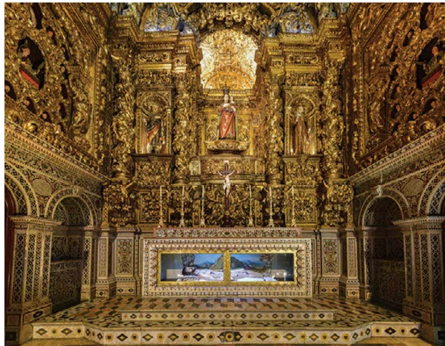
■ Wnętrze Kościoła św. Rocha

Pod galerią chóru można podziwiać przepiękne sewilskie azulejos z końca XVI w., a wśród obrazów ozdabiających boczną ścianę znajduje się przedstawienie polskiego jezuitę, św. Stanisława Kostki.