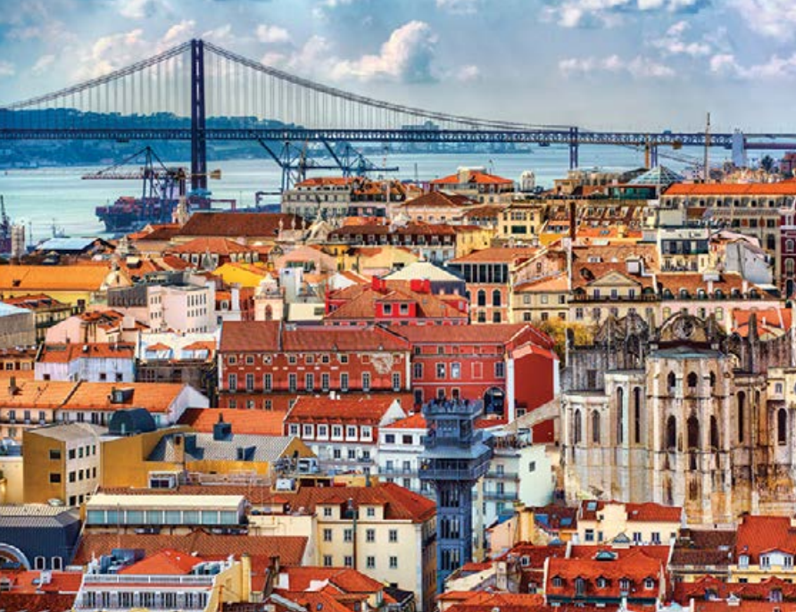
■ Winda Gloria w Lizbonie łącząca centrum miasta z dzielnicą Bairro Alto