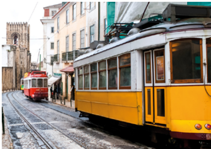
▲ Żółty tramwaj w Alfamie

Nazwa dzielnicy – podobnie jak miejscowości w Portugalii rozpoczynających się od przedrostka „al” – pochodzi z języka arabskiego: słowo al-hama oznacza fontannę miejską. Za czasów Maurów Alfama stanowiła odrębne miasto. W średniowieczu zamożniejsi mieszkańcy wyprowadzali się stąd w obawie przed trzęsieniem ziemi. Na miejscu pozostali najbiedniejsi, głównie rybacy, właściciele tawern i małych sklepików. Okazali się oni wytrwałymi stróżami tradycji – Alfama od tamtego czasu niewiele się zmieniła. Portugalskie kobiety, podobnie jak w Bairro Alto, godzinami przesiadują w oknach, plotkując i obserwując przechodniów. Mężczyźni zbierają się w barach, gdzie dopełniają