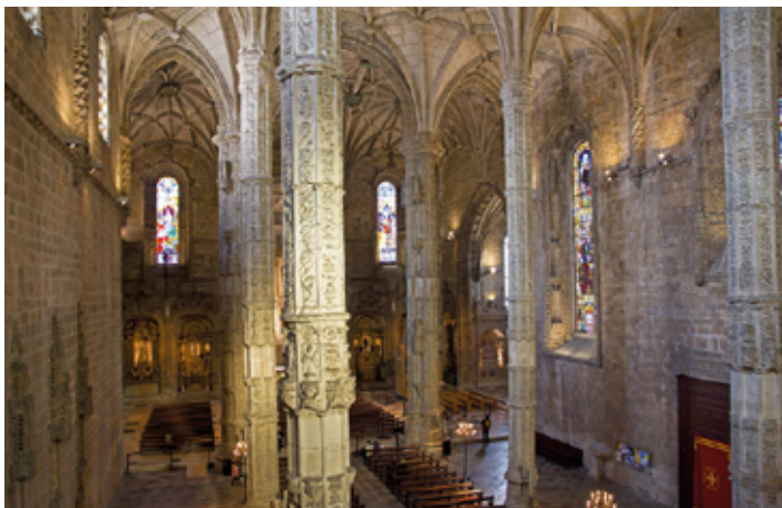
▲ Kościół w kompleksie klasztoru Hieronimitów

przypraw), że wystarczyły na stworzenie budowli, którą oglądać można obecnie. Autorem jej projektu był Diogo de Boitaca, twórca stylu manuelińskiego. Od 1517 r. budowę klasztoru kontynuował Hiszpan Juan de Castilho, urozmaicając wnętrza elementami estetyki plateresco , czyli stylu złotniczego nawiązującego do geometrycznej ornamentyki mauretańskiej. Architektoniczną kropkę nad „i” postawił Diogo de Torralva, dobudowując główną kaplicę, prezbiterium i uzupełniając dwie kondygnacje klasztoru. Prace przerwano, gdy