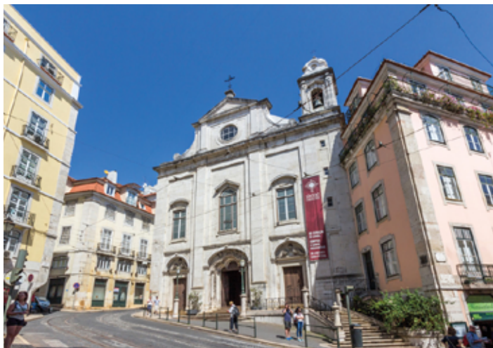
▲ Igreja da Madalena