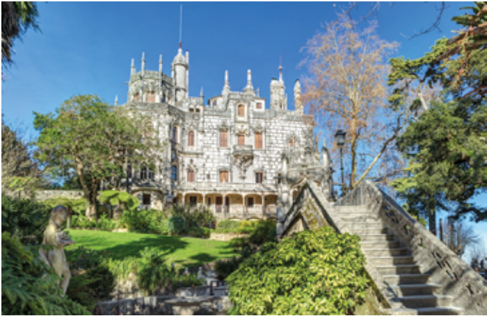
▲ Sintra – Quinta da Regaleira

Obecnie można zwiedzić znaczną część pałacu (wraz z przedziwną salą biblioteczną, której podłoga obramowana lustrami wydaje się być zawieszona w powietrzu), a także ogrody. Park jest ogromny, a alejki na tyle przypominają labirynt, że lepiej zaopatrzyć się w mapę posiadłości (dostępna gratis w kasie). Warto też zabrać latarkę. Ogrody położone na wzniesieniu są przecinane systemem tunelów i tajemnych przejść, które mimo że nieoświetlone, są jak najbardziej bezpieczne.