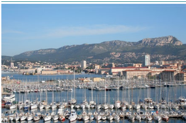
Port w Tulonie

Kościół św. Ludwika wzniesiony w XVIII w. jest pięknym przykładem architektury neoklasycystycznej.