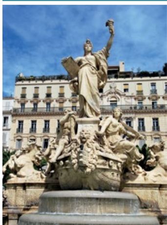
Tulon – Fontaine de la Fédération

Ten plac jest sercem nowoczesnego miasta. Mieści się tu monumentalna Fontaine de la Fédération, wzniesiona w 1889 r. dla uczczenia stulecia Republiki.