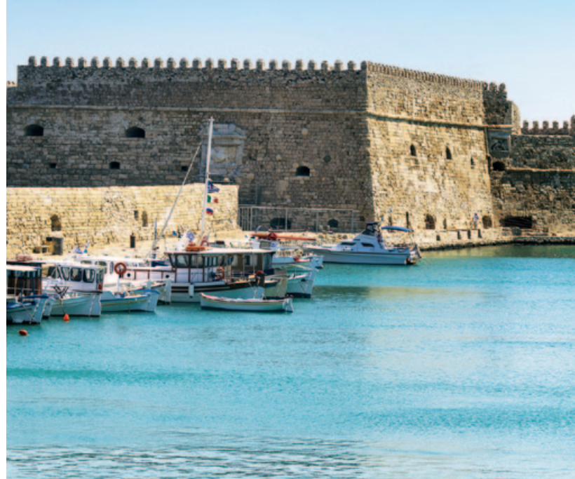
Port w Heraklionie i twierdza Koules

Cretaquarium jest obowiązkowym punktem programu zwiedzania miasta. Dzieciom spodoba się również Muzeum Historii Naturalnej Krety i Wschodniej Części Basenu Morza Śródziemnego.