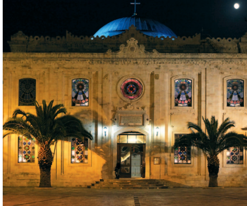
Kościół Agios Titos

Nikos Kazantzakis urodził się w Heraklionie (Kandii) w 1883 r. W 1892 r., jako młody chłopiec, był świadkiem powstania przeciwko Turkom, w wyniku którego jego rodzina musiała wyjechać do Aten. Po ukończeniu studiów we Francji, gdzie był uczniem Bergsona, Kazantzakis zainteresował się filozofią Nietzschego i został tłumaczem jego dzieł. Pisarz, uznawany przez niektórych za nihilistę, był mistykiem, ale zachował dystans wobec chrześcijaństwa, interesował się też buddyzmem, a sam siebie nazywał marksistą. Ostatnie lata życia spędził we Francji, gdzie napisał swe najbardziej znane powieści . Niektóre z nich zostały zekranizowane: Grek Zorba , Chrystus ukrzyżowany po raz wtóry i Ostatnie kuszenie Chrystusa . Za życia był „czarną owcą” Greckiego Kościoła Prawosławnego, został nawet ekskomunikowany, ale władze kościelne zorganizowały mu państwowy pogrzeb w 1957 r.