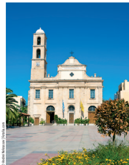
■ Fasada katedry w Chanii

Szczególnie ważnym eksponatem z okresu minojskiego jest odcisk w glinie (zw. Master Impression, gabłota nr 11 po prawej stronie od wejścia, nr ewidencyjny KH 1563). Ukazuje on dostojnego mężczyznę, przypuszczalnie wodza bądź władcę, na tle obwarowanego murami miasta, które przywołuje na myśl zabudowę minojską (zwieńczenia murów pokrywa dekoracja stylizowanych rogów). Kłopot polega na tym, że do dziś archeolodzy nie znaleźli wyraźnych śladów fortyfikacji wokół osad Minojczyków (może poza Zakros).