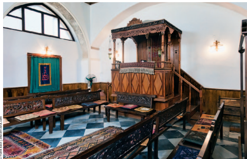
■ Wnętrze synagogi w Chania

Kontynuując spacer ulicą Chalidon na północ, czyli w kierunku portu, i skręcając dwa razy w lewo, dojdziemy do ulicy Kondilaki i znajdującej się tu synagogi Etz Hayyim , z fundamentami z XV w. Żydzi mieszkający w Chanii od setek lat mieli w mieście dwie bożnice. Synagoga Beth Shalom legła w gruzach w czasie niemieckich