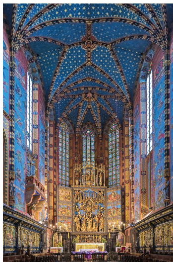
▲ Prezbiterium kościoła Mariackiego