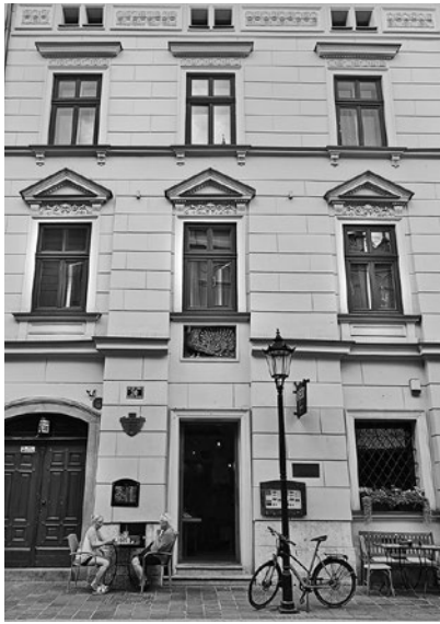
Kamienica Pod Pawiem