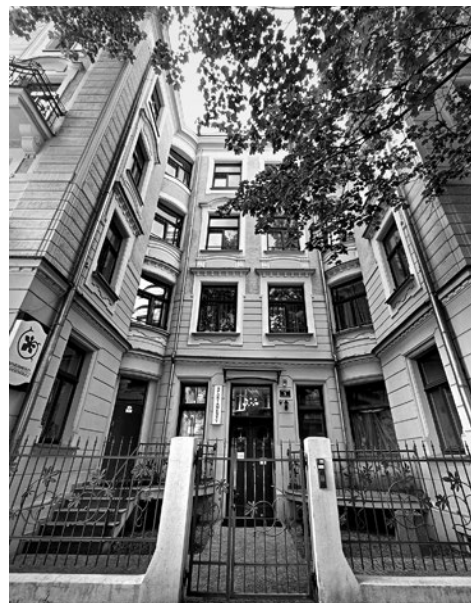
Kamienica przy ulicy Bonerowskiej

Wkrótce jednak okazało się, że mieszkanie jest zbyt małe, ponieważ do Krakowa chciano sprowadzić teściową Lema. Młode małżeństwo zapisało się do spółdzielni mieszkaniowej w oczekiwaniu na przydział domu. Plan udało