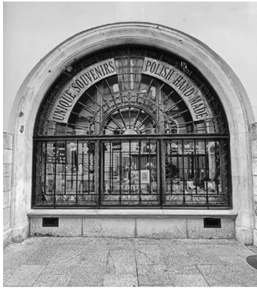
Skład Towarów u Karpra Ryxa

Śpiewającą Żabą zaprojektowanej przez Teodora Talowskiego, skąd ma doskonały widok na zalaną przez wielką powódź ulicę Wenecja. Akcja cyklu powieści toczy się na przełomie XIX i XX wieku, a autorce, Maryli Szymczkowej (tak naprawdę autorom, pod tym pseudonimem kryją się bowiem Jacek Dehnel i Piotr Tarczyński), z dużą wnikliwością i humorem udało się oddać klimat mieszczańskiego, prowincjonalnego Krakowa tamtych czasów.