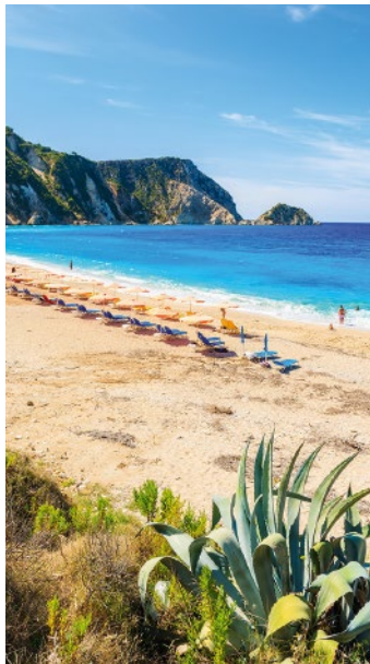
▲ Plaża Petani na Kefalonii

Doskonała zarówno dla szukających wypoczynku na delikatnym, ciepłym piasku, jak i dla amatorów sportów wodnych. Dzięki temu, że jest bardzo szeroka i długa, każdy znajdzie tu dla siebie miejsce.