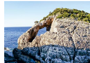
▲ Skalista wyseпка Korakonisi

Na wysepkę, słynącą z 20-metrowego łuku skalnego, można przejść suchą stopą. Podwodne groty i wąwozy przy Korakonisi to świetne miejsce dla amatorów snorkelingu.