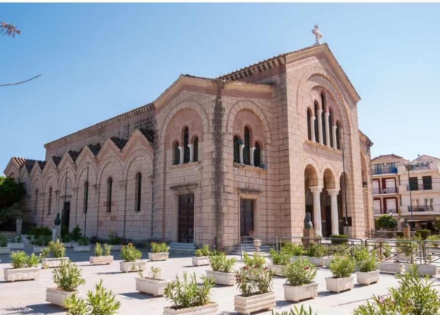
▼ Kościół Agios Dionisios

Tuż przy porcie stoi kościół Agios Dionisios. Świątynia pod wezwaniem patrona wyspy Zakynthos – św. Dionizego – została zbudowana w 1708 r. To jeden z trzech zabytków w mieście, które przetrwały trzęsienie ziemi w 1953 r. Wejście do kościoła wymaga stosownego ubrania – przede wszystkim zakrycia ramion