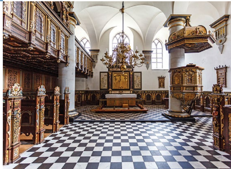
▼ Kaplica zamku Kronborg

W galerii królewskiej na kolejnym piętrze znajdziemy malowidła prezentujące najważniejsze wydarzenia z dziejów Danii. Kolejne obrazy o tematyce historycznej, które pierwotnie znajdowały się w pałacu Rosenberg, wiszą na ścianach sali balowej . To zbudowane w czasach Fryderyka II