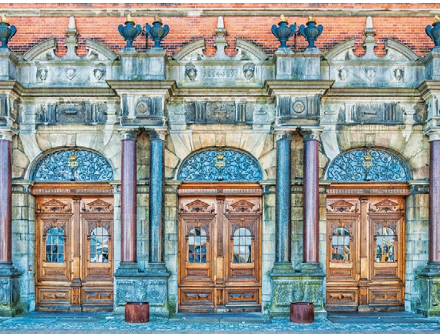
▲ Wejście do budynku dworca kolejowego