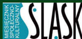
Miesięcznik społeczno-kulturalny „Śląsk”