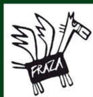
Kwartalnik literacko-artystyczny „Fraza”