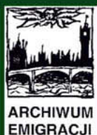
Czasopismo „Archiwum Emigracji. Studia – szkice – dokumenty”