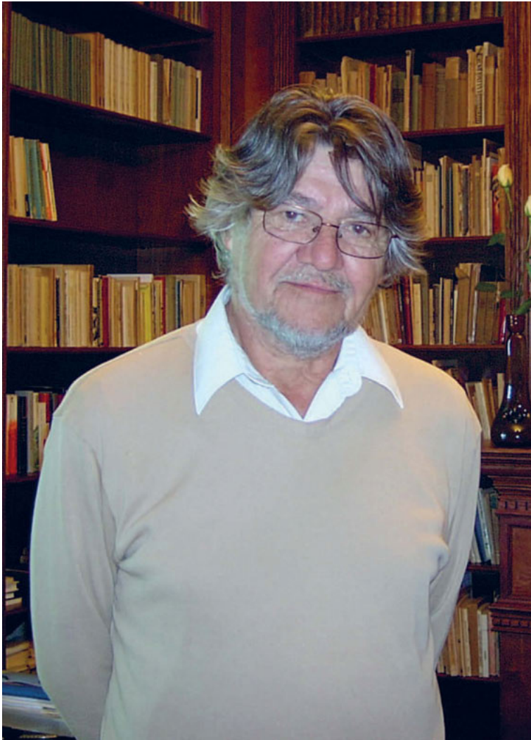
Bogdan Czaykowski (1932–2007)

A handwritten signature in black ink, consisting of a large, stylized loop followed by a horizontal line extending to the right.