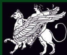
Związek Pisarzy Polskich na Obczyźnie