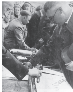
▲ Ostatnie zdjęcie naszego Ojca. Wbija gwóźdź do sztandaru Akcji Katolickiej (Rudki 1936 r.)