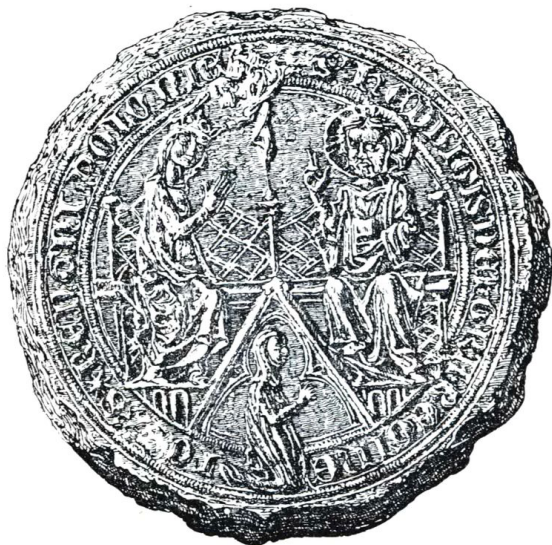
Pieczęć Jadwigi kaliskiej.

pomoc otrzymał od Łokietka nominację na wójta. W 1304 roku Władysław powrócił do Polski i rozpoczął kampanię zbrojną przeciwko Wacławowi II, który w międzyczasie umocnił swoją pozycję małżeństwem z córką Przemysła II. Łokietek zdołał odzyskać księstwo sandomierskie, sieradzko-łęczyckie i Kujawy Brzeskie, a po wygaśnięciu dynastii Przemyslidów jako nowy książę krakowski uroczystie wkroczył do stolicy Małopolski 1 września 1306 roku.