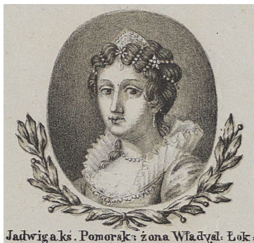
Jadwiga, żona Władysława Łokietka i matka Kazimierza Wielkiego (litografia z XIX wieku).