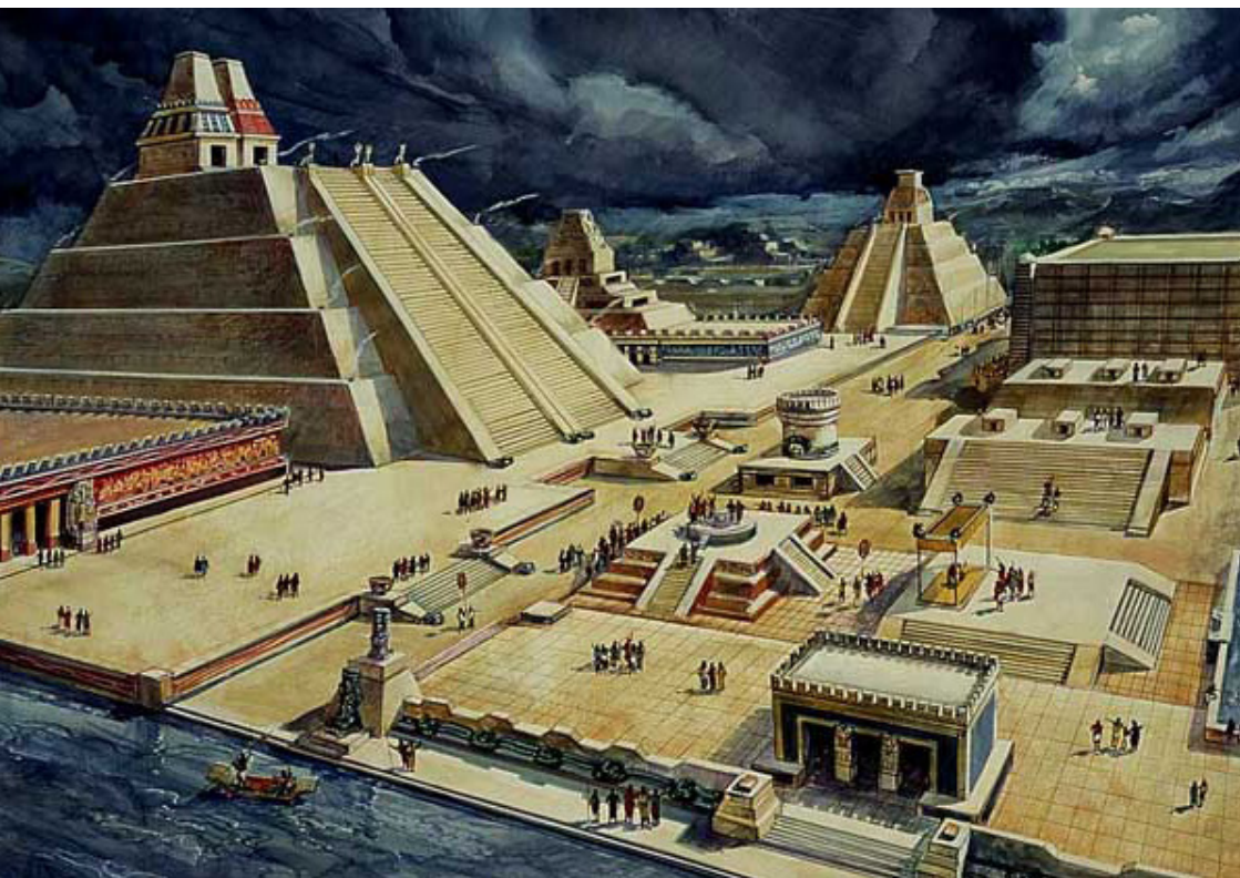
Tenochtitlan – stolica imperium Azteków

czyli Pani Dwoistości. Koncepcja świata nahuatl opierała się na podkreślaniu dualizmu niemal w każdej sferze życia. Znajduje ona swoje odzwierciedlenie w mitologii, a konkretnie w micie o stworzeniu pierwszej pary ludzi. Pierwszymi ludźmi, którzy zostali powołani do życia byli mężczyzna Uxumoco i kobieta Cipactonal. Dualizm płci kobieta-mężczyzna znalazł swe odzwierciedlenie także w obowiązkach jakie spoczęły na azteckim Adamie i Ewie. Odtąd kobieta miała zajmować się przędzeniem i tkaniem, a także czynić praktyki magiczne i lecznicze. Mężczyzna natomiast miał uprawiać ziemię. W azteckiej mitologii odnajdujemy różne wersje mitu dotyczącego stworzenia pierwszych ludzi, jednakże ta jest najbardziej popularna.