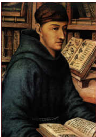
Bernardino de Sahagun

Charakterystyczną cechą świata Azteków stanowiła wszechobecna zasada dualizmu. Źródłem tej zasady było najwyższe bóstwo Mexików – Ometeotl, Pan Dwoistości, który łączył w sobie dwa pierwiastki – męski, Ometecuhtli i żeński – Omecihuatl,