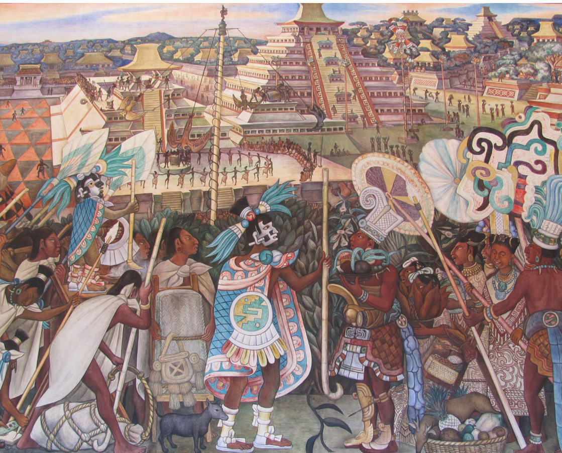
Świat Azteków na muralu autorstwa Diego Rivery, Pałac Narodowy w Meksyku, fot. Piotr Bejowski