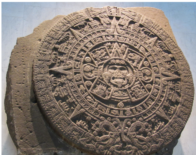
Kamienny dysk przedstawiający aztecki mit o powstaniu świata, Narodowe Muzeum Antropologiczne w Meksyku, fot. Piotr Bejrowski

w czasie pierwotnej kreacji świata, później pojawiły się ponownie jako utkane „mantas” czyli koce. To także w pewnym stopniu wskazuje na rolę kobiety, która powinna zajmować się produkcją tkanin.