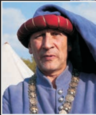
Średniowieczny florencki patrycjusz