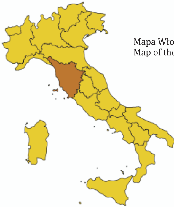
Mapa Włoch z zaznaczoną Toskanią Map of the Italy with marked Tuscany