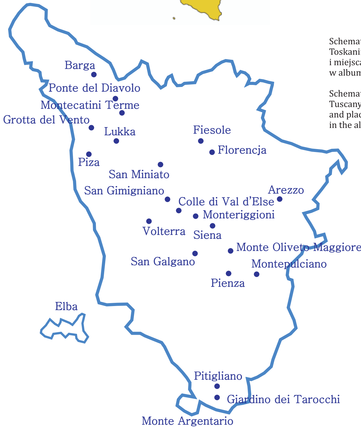
Schematyczna mapa Toskanii z miastami i miejscami opisanymi w albumie