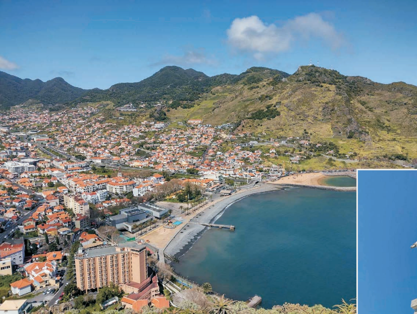
Machico to drugie pod względem wielkości miasto i port na Maderze. (Poniżej) Statua Chrystusa Króla