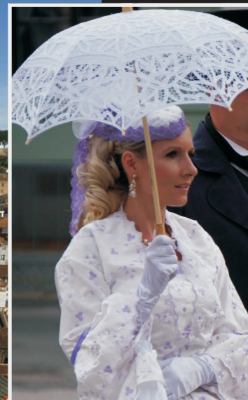
XIX-wieczna mieszkanka Lizbony