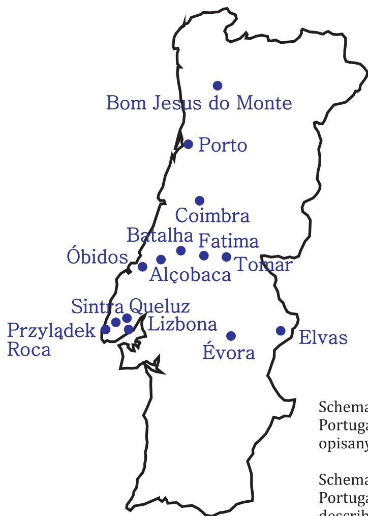
Schematyczna mapa Portugalii z miastami opisanymi w albumie