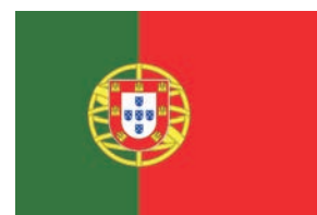
Flaga republiki Portugalii