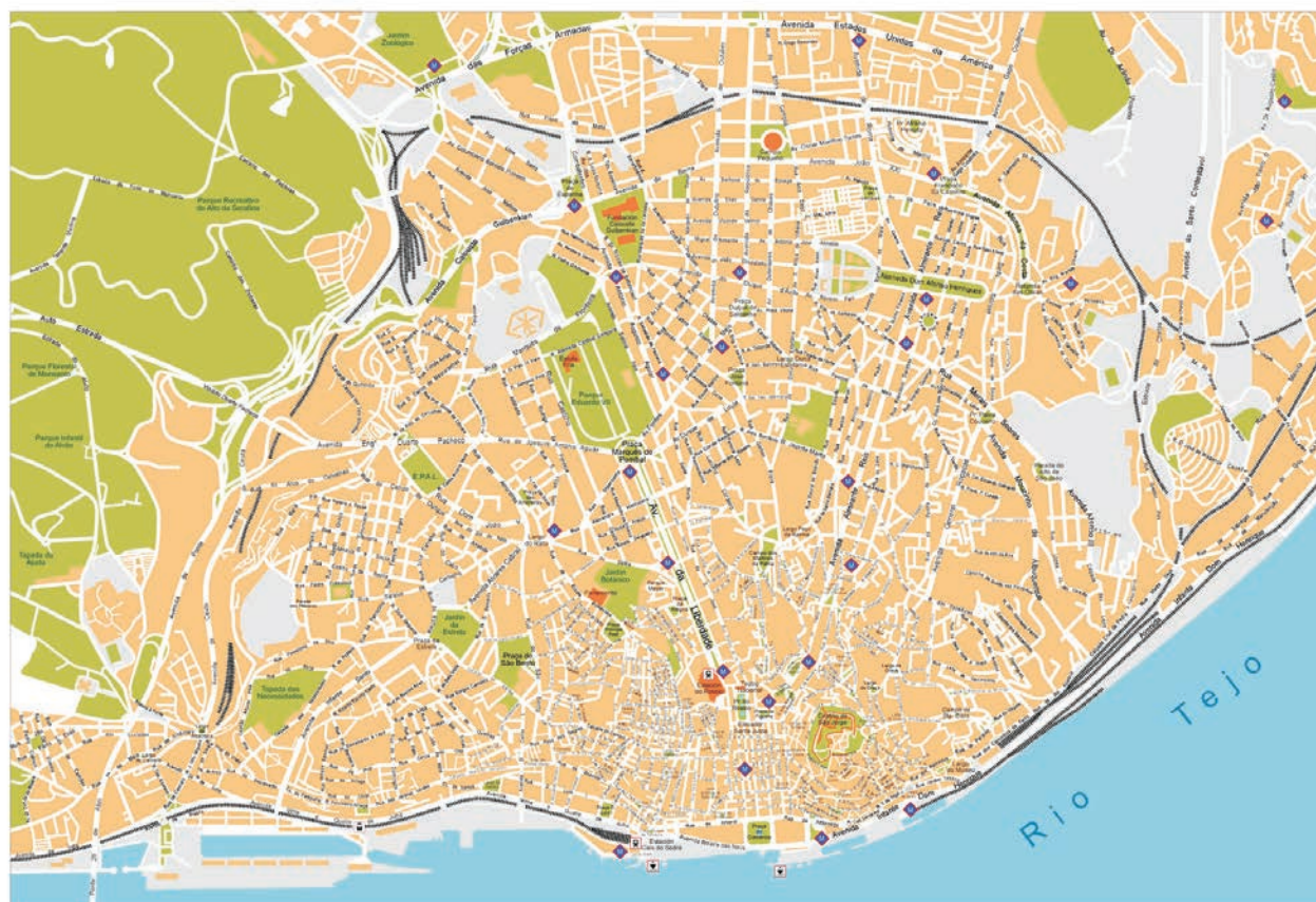
Mapa historycznego centrum Lizbony