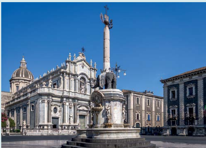
Piazza del Duomo w Katanii

Pierwszy dzień warto rozpocząć od zanurzenia się w atmosferze miasta, czyli wyprawy na targ rybny ★ (s. 83) na piazza Alonzo di Benedetto. Po spacerze można wyruszyć na starówkę, której wizytówką jest dostojny piazza del Duomo ★★ (s. 80) słynący z barokowych budowli, Fontana dell'Elefante ★ (s. 80) i katedra ★★ (s. 81).