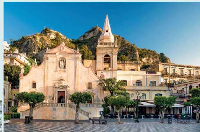
Piazza del Duomo w Acireale